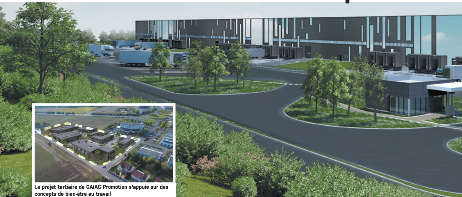
Le projet tertiaire de GAIAC Promotion s'appuie sur des concepts de bien-être au travail

D'importants projets d'implantations d'entreprises se concrétisent.