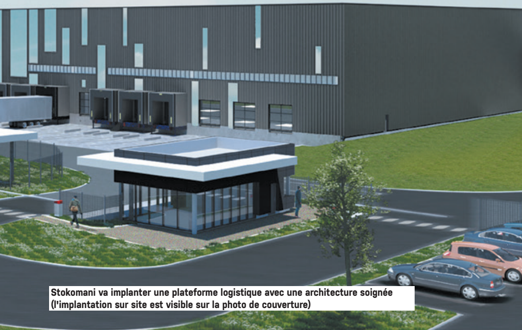
Stokomani va implanter une plateforme logistique avec une architecture soignée (l'implantation sur site est visible sur la photo de couverture)