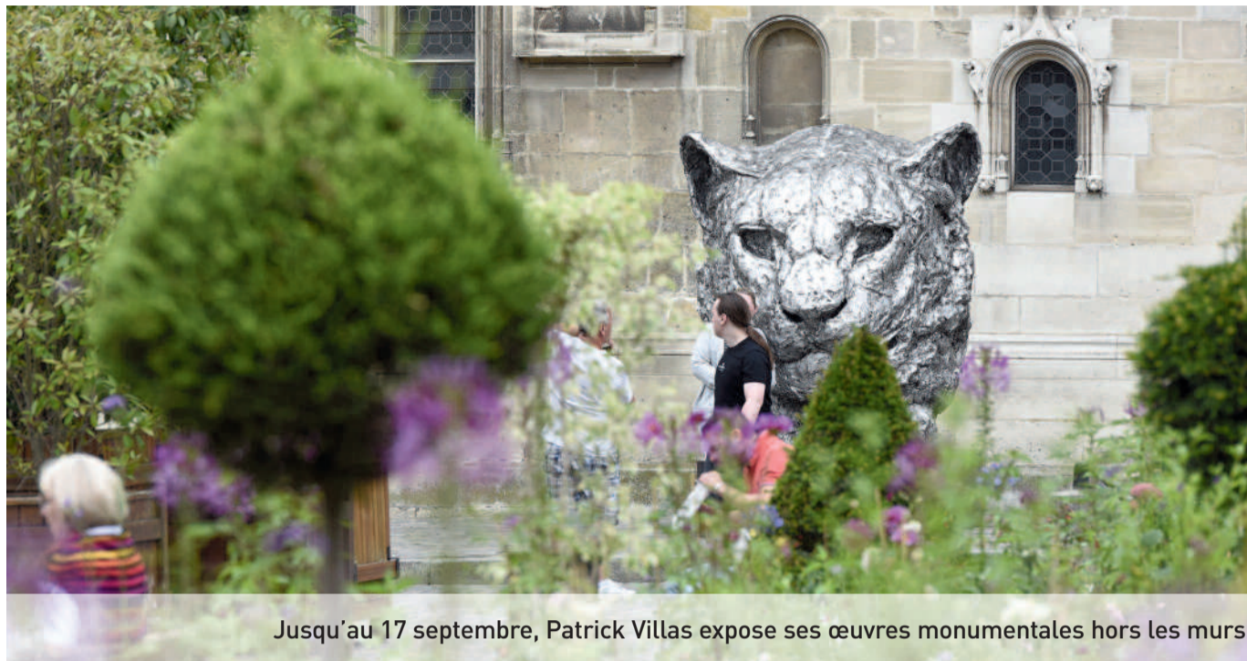
Jusqu'au 17 septembre, Patrick Villas expose ses œuvres monumentales hors les murs.