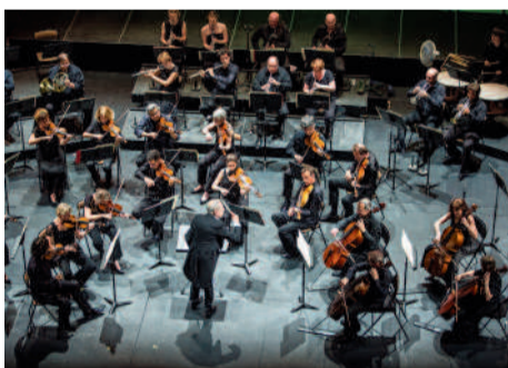
◀ Concert de gala du Festival des Forêts au Théâtre Impérial, avec l'Orchestre de Picardie.