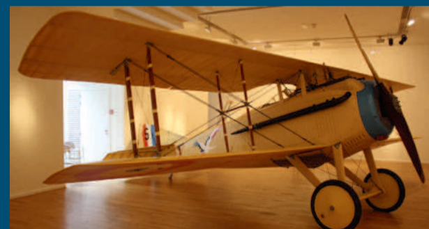
SPAD 7 appartenant à Louis Blériot - DR

Exposition du SPAD 7, place de l'Hôtel de Ville