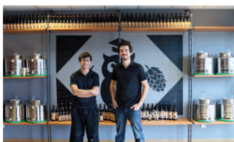
Ecol'aux Mousses 6 chemin d'Armancourt