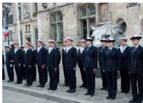
◀ Les 20 jeunes de la 1 ère promotion de la Préparation militaire marine reçoivent un diplôme lors d'une cérémonie place de l'Hôtel de Ville.