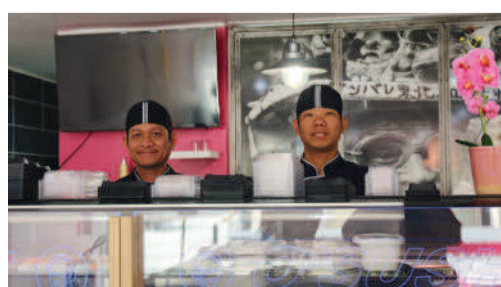
O'sushiz 46 rue Jeanne d'Arc