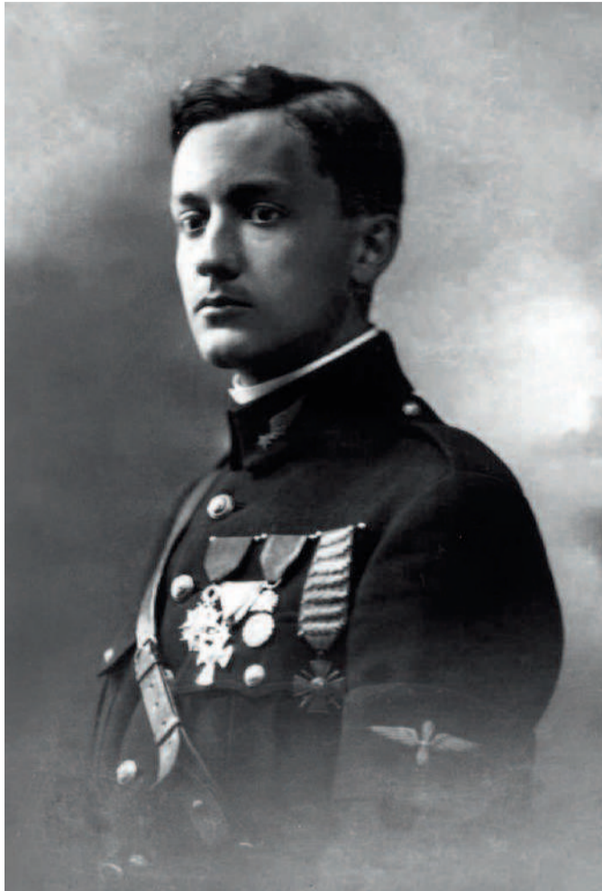
Portrait de Georges Guynemer

Le 11 septembre 1917 est une date majeure pour le monde de l'aviation et la ville de Compiègne. Il y a cent ans, le Capitaine Georges Guynemer disparaissait au combat. Pour honorer la mémoire de cet emblématique aviateur compiégnais, plusieurs manifestations seront organisées, dont l'exposition, du 9 au 12 septembre place de l'Hôtel de Ville, d'un SPAD 7 prêté par le petit-fils de Louis Blériot.