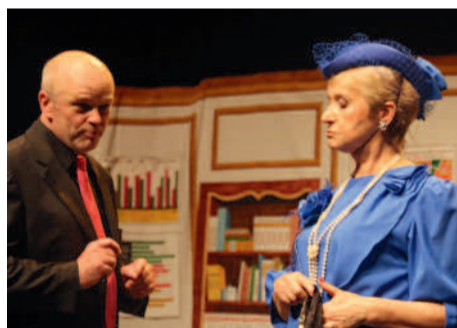
◀ Le succès a été au rendez-vous pour les acteurs de l'Atelier Théâtre des aînés et leur nouveau spectacle "Dessous ministériels".