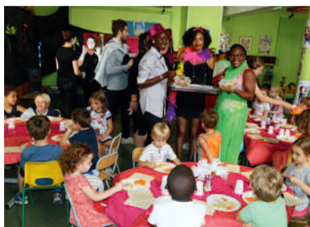
Dîner-spectacle au centre de loisirs Jeanne d'Arc, ▶ un des moments phares proposés aux petits vacanciers compiégnois.