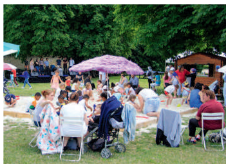
◀ L'été à Compiègne Plage, c'est fun !