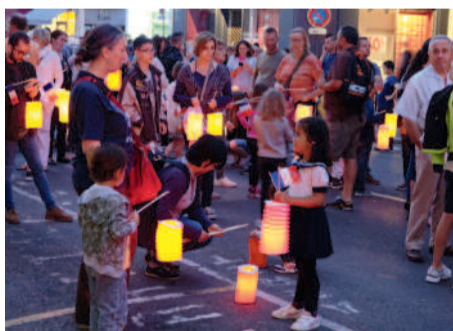
Cérémonies patriotiques ▶ et retraite aux flambeaux ont précédé le traditionnel feu d'artifice du 13 juillet à l'hippodrome.