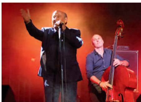
La soirée Palais en Jazz avec Michel Jonasz et le Panam Panic ▶ restera assurément dans les annales.