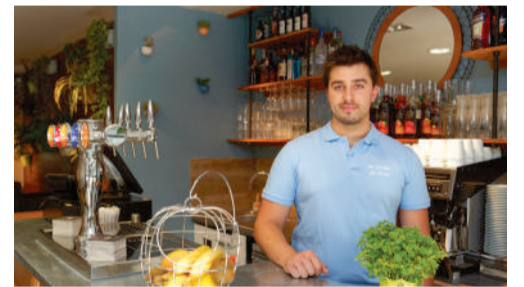
Au jardin de Léna, restaurant-bar à salades, 20 rue de l'Etoile.