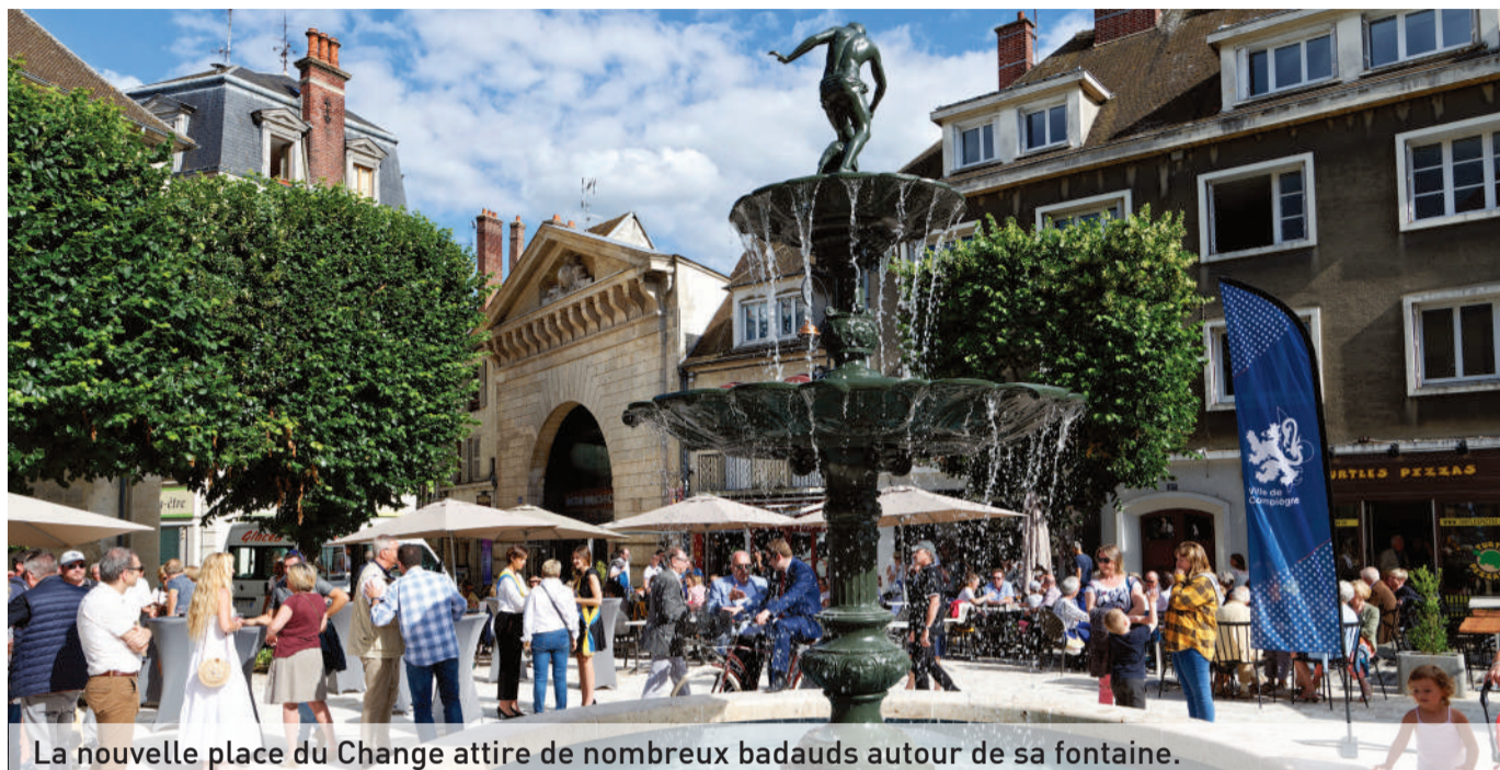
La nouvelle place du Change attire de nombreux badauds autour de sa fontaine.