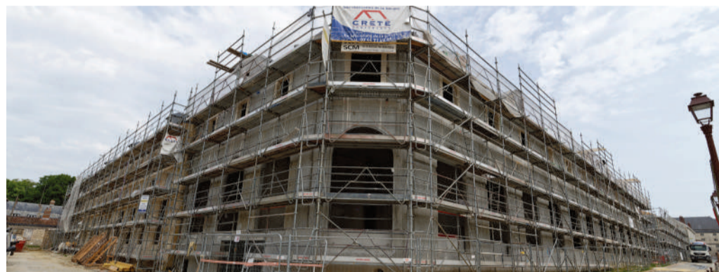
Le programme Eiffage.