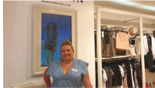
Morgan, magasin de prêt-à-porter féminin, 9 rue Jean Legendre.