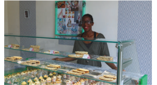
Fati's Cupcake Events, biscuiterie, 7bis rue du Harlay.