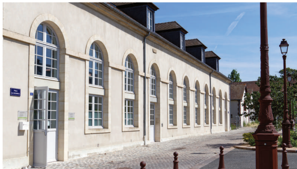
La résidence "Les lucarnes" accueille activités professionnelles et habitants.