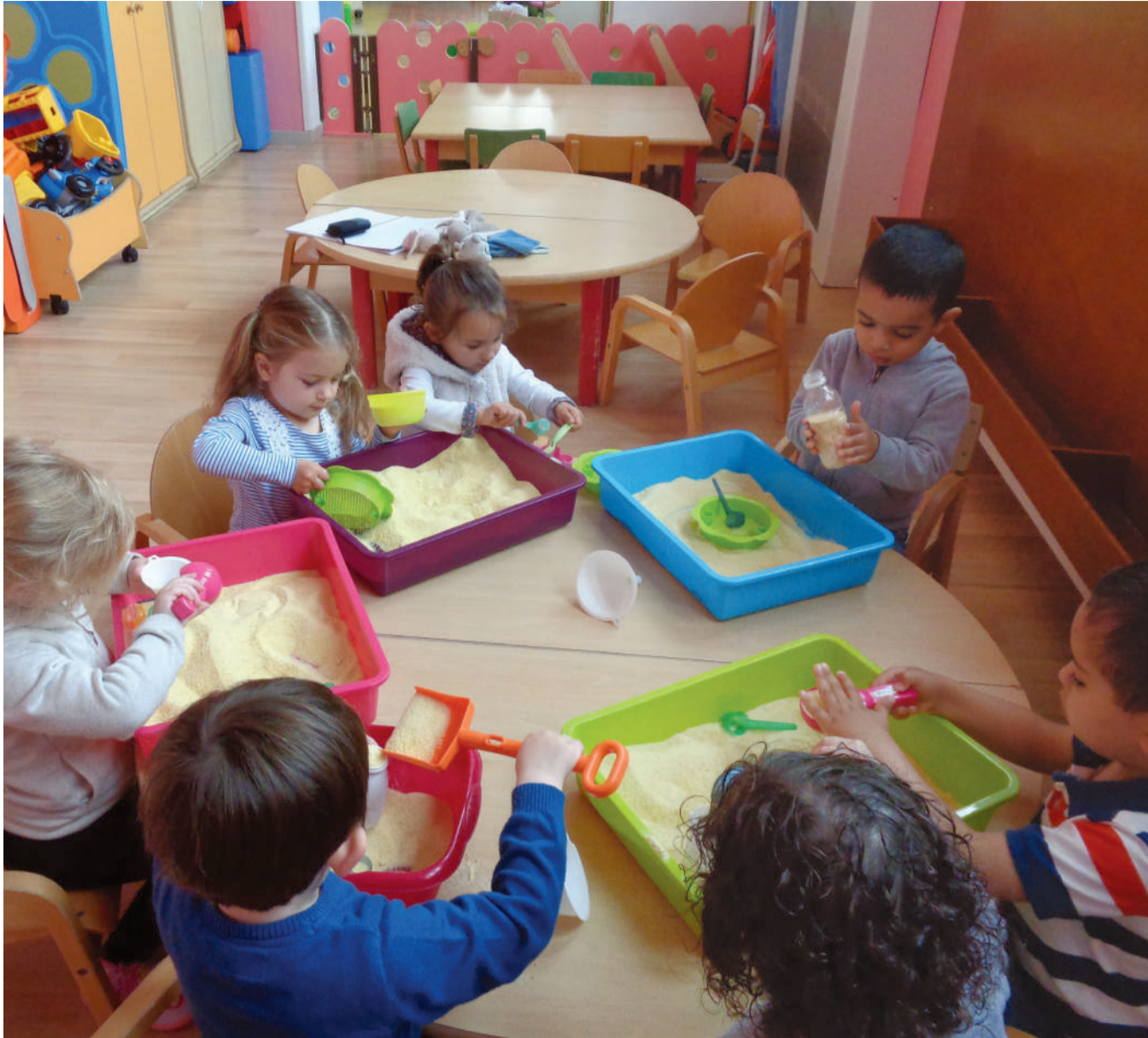
De nombreuses activités d'éveil sont proposées au sein des différentes structures d'accueil.