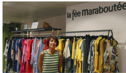
La Fée Maraboutée, magasin de prêt-à-porter féminin, 11 rue des Bonnetiers.