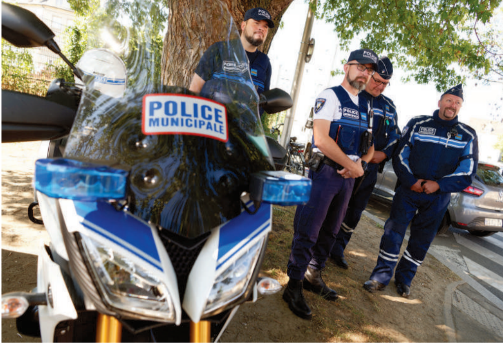
Les Polices municipales de Compiègne et Margny-lès-Compiègne coopèrent pour lutter contre l'insécurité routière et la délinquance.

La mise en commun d'agents de Police municipale entre nos deux villes, Compiègne et Margny-lès-Compiègne, prendra effet à compter du 1 er septembre 2019. Il s'agit d'une expérimentation d'un an qui pourra être reconduite pour une durée de 3 ans.