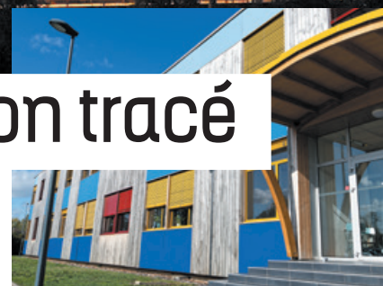
Parc technologique des rives de l'Oise