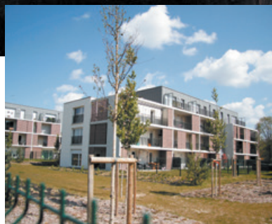
Le Camp des Sablons