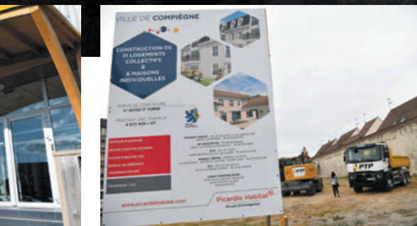
Première pierre au nouveau square Acary