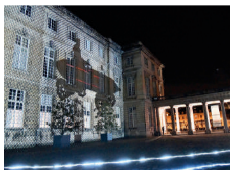
Nuit de la lecture ▶ Savant jeu de lumières autour de la « Jamais Contente » dans la cour d'honneur du Château de Compiègne.