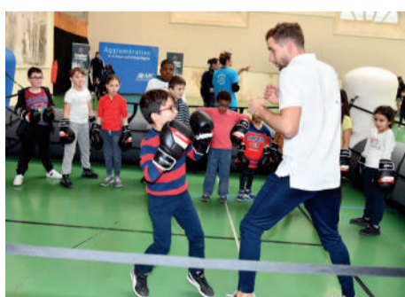
◀ Semaine olympique et paralympique Les enfants de l'école Augustin Thierry et des centres de loisirs s'initient à plusieurs disciplines sportives.