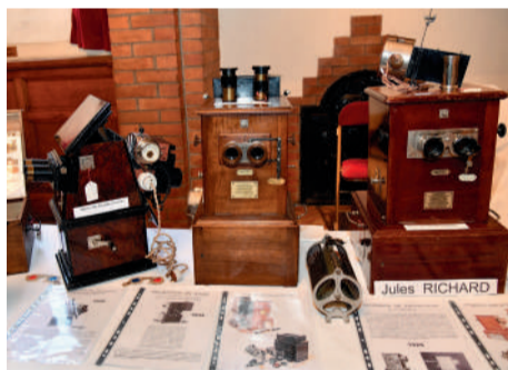
◀ Parmi les objets exposés au Salon du collectionneur, les visiteurs ont pu découvrir des systèmes de projection en relief, pour certains centenaires.