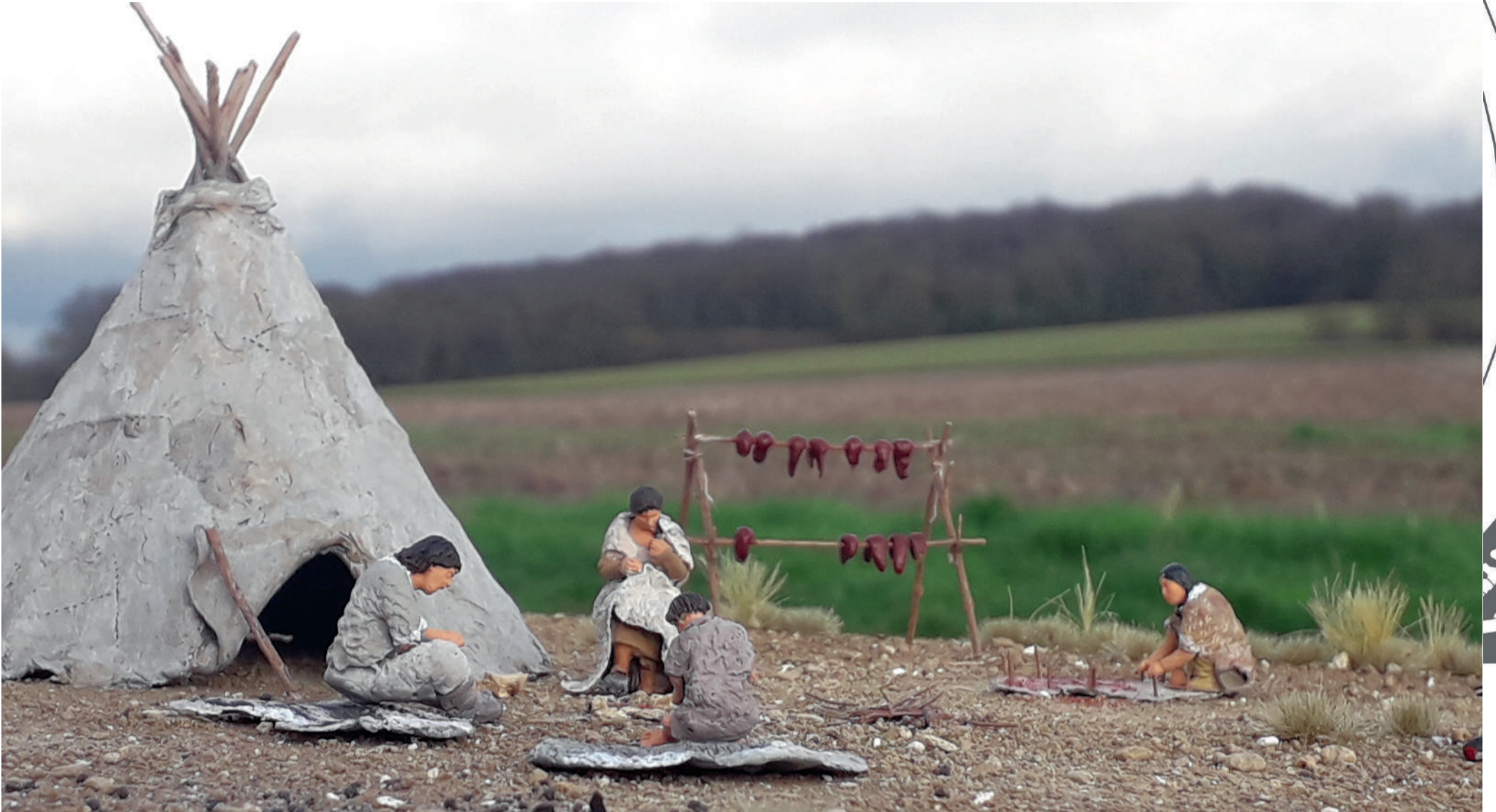
Campement de chasseurs de rennes à Verberie à l'époque magdalénienne (autour de -12 500).