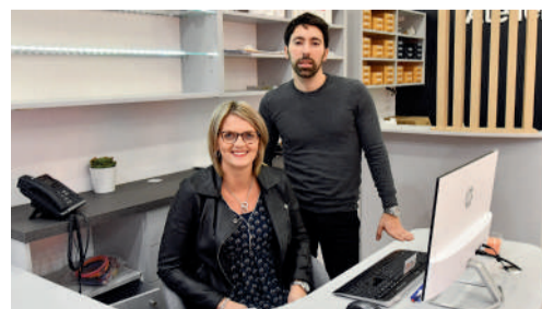
"Idéal Audition", centre auditif, 28 rue Solferino.