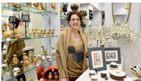
"Lovitsoo", boutique de décoration intérieure, jouets en bois et articles de puériculture, 10 rue des Bonnetiers.