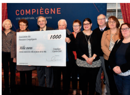
◀ Les Danseurs compiégnois font un don de 1000 euros au profit de la Plateforme de réussite éducative.