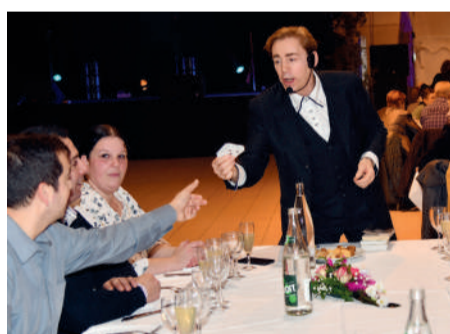
Le quartier de la Victoire ▶ fête ses 60 ans lors d'une soirée-cabaret au Centre de rencontres de la Victoire.