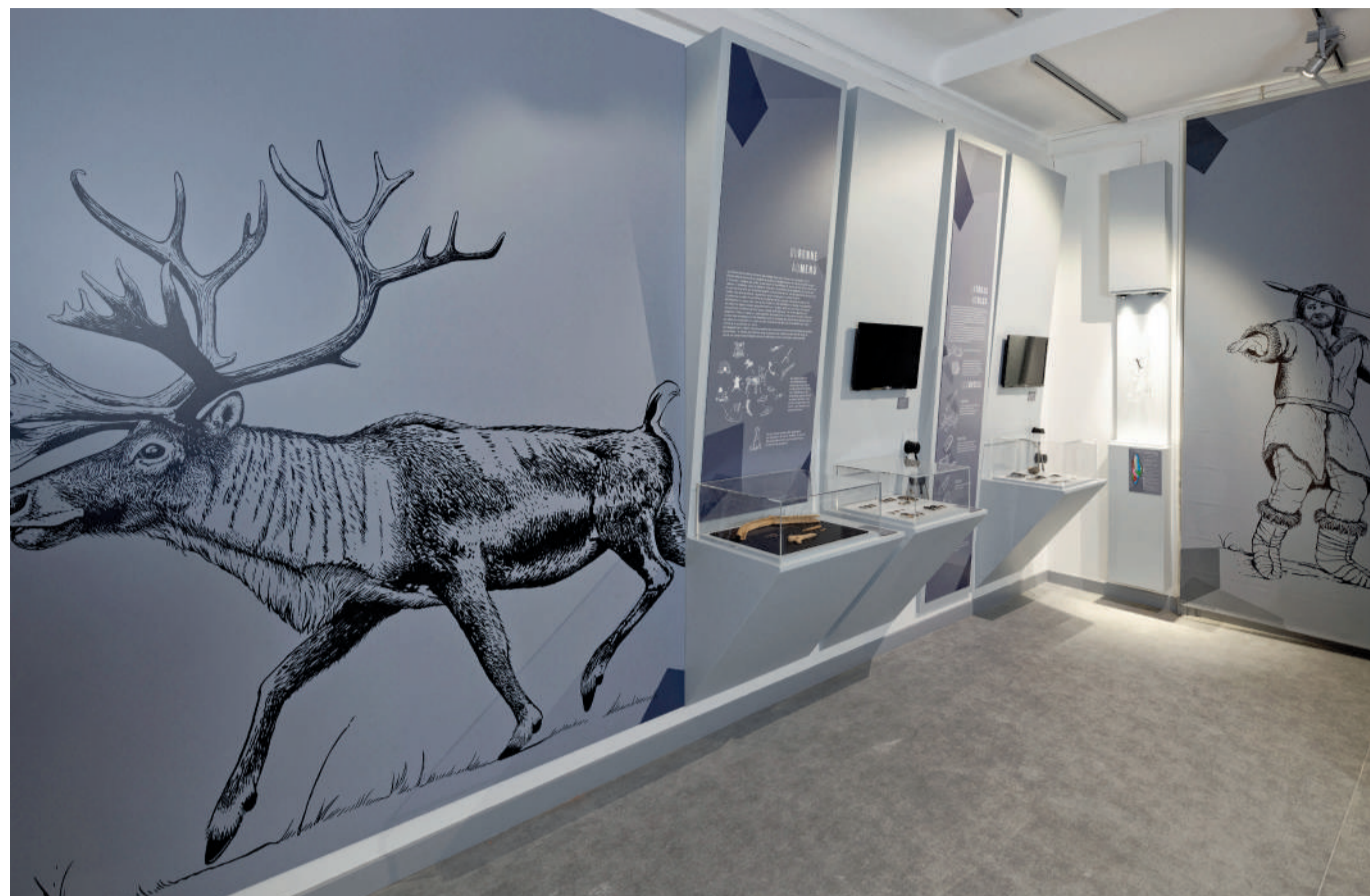
Espace consacré au site magdalénien de Verberie.

Le deuxième site exposé est le site préhistorique du Buisson Campin. Il se trouve en bordure de la rivière Oise, à l'extrémité nord de la commune de Verberie (à environ 80 mètres de la rive actuelle de l'Oise). Ce gisement paléolithique a été régulièrement inondé par les crues naturelles de la rivière qui ont recouvert d'alluvions les vestiges sans les perturber. Les structures d'habitat, les restes de faune et