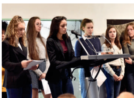
◀ 150 jeunes des collèges et lycées de Compiègne ont participé à la Journée internationale en mémoire des victimes de l'Holocauste et de la prévention des crimes contre l'humanité.