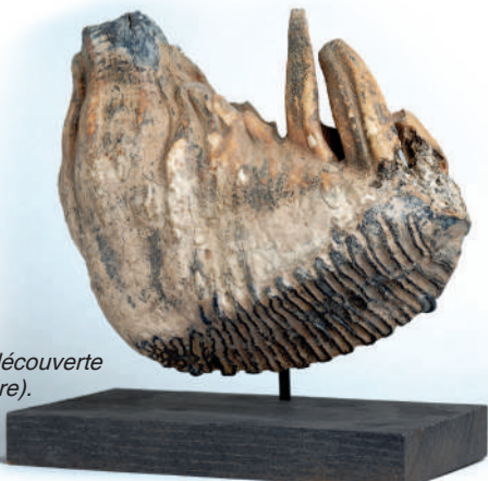
Molaire de mammouth découverte à Chevières (Quaternaire).

environnant et une matière d'étude majeure pour les scientifiques. Ce site est considéré comme le plus riche gisement de résine fossile d'Europe de l'Ouest. La deuxième formation géologique témoigne d'une époque plus ancienne, le Paléocène (entre -58 et -57 millions d'années). Une première couche, composée des dépôts marins laissés par la Mer du Nord, contenait des restes de poissons et de tortues marines. Une seconde couche située au-dessus, déposée en eau douce ou saumâtre, a livré des restes de végétaux fossiles et de lignite (charbon naturel fossile). Elle était par ailleurs riche en restes de vertébrés datant de la fin du Paléocène : animaux terrestres et d'eau douce, tels les poissons, les crocodiles, les oiseaux, les mammifères et les tortues.