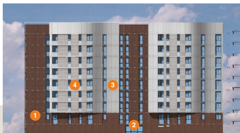
1 ère esquisse pour la réhabilitation des immeubles square Berlioz (Archétude pour Picardie Habitat). Il s'agit d'une orientation possible et non figée des rendus définitifs.