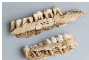
Mâchoires de rennes (Verberie, vers -12 500 ans).

d'industrie lithique ont ainsi été conservés en place jusqu'à nos jours.