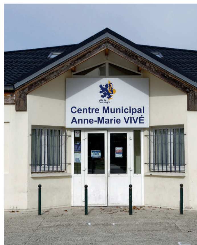
Les équipements publics de proximité bénéficieront également d'aménagements.