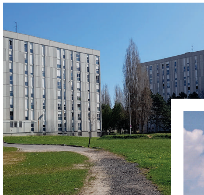
Le square Berlioz sera entièrement rénové.