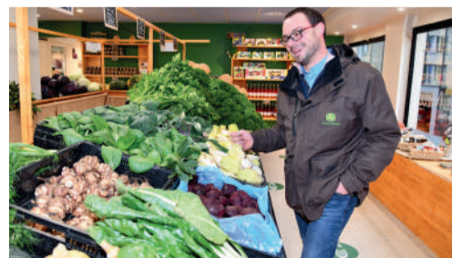
"La ferme du Metz", produits de la ferme, 6 place du Marché aux Herbes.