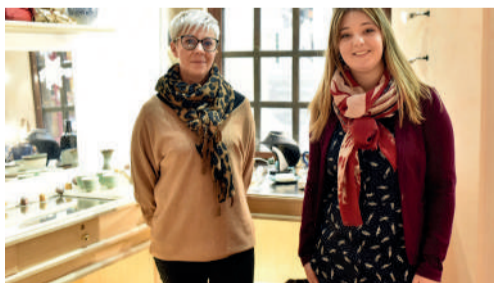
"Au Dép'Art c'était", boutique dépôt-vente d'art et d'artisanat, 10 rue des Lombards.