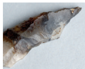
Perçoir (Verberie, vers -12 500 ans).