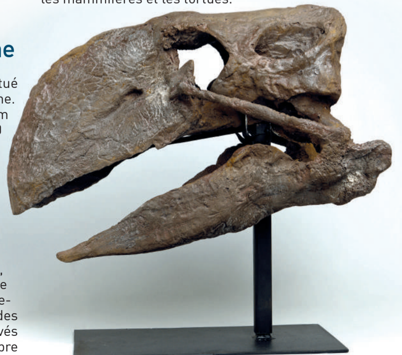
Moulage d'un crâne de Gastornis (Rivecourt, -57 millions d'années).