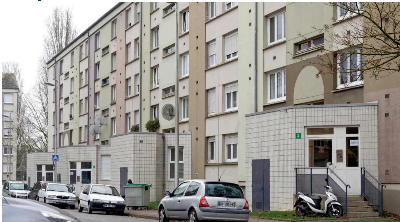
Les quartiers des Musiciens et des Maréchaux vont être réhabilités dans les années à venir. Un engagement majeur pris le 14 janvier, avec la signature du protocole ANRU II par le Préfet de l'Oise, le Directeur Général de l'ANRU et les différents partenaires, dont la Ville et l'ARC.