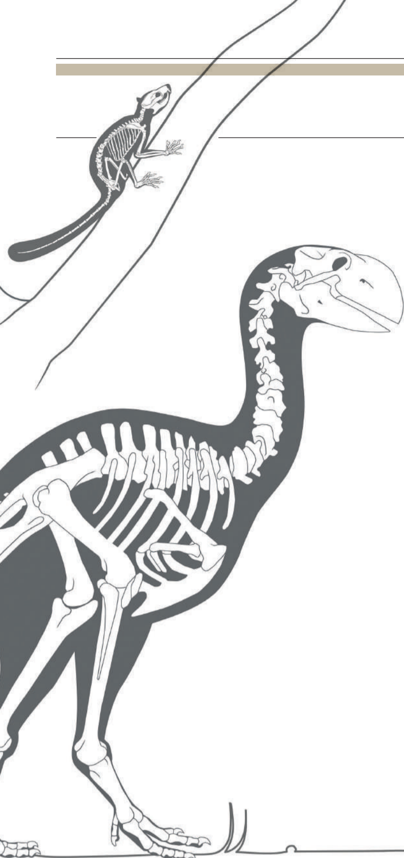
Oiseau géant Gastornis et mammifère Plesiadapis (Rivecourt, environ - 57 millions d'années).