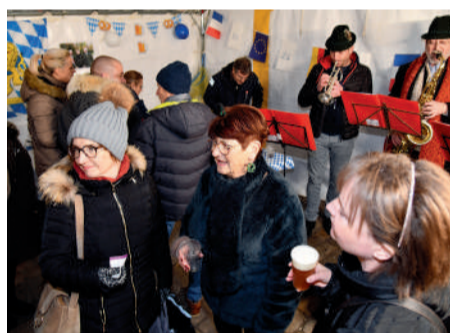
La Fête de l'amitié franco-allemande ▶ a été l'occasion de goûter aux saucisses, bretzels et autres spécialités bavaroises.