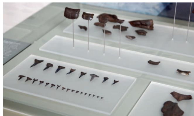
Vitrine présentant les fossiles des espèces marines (Rivecourt, environ -58 millions d'années).