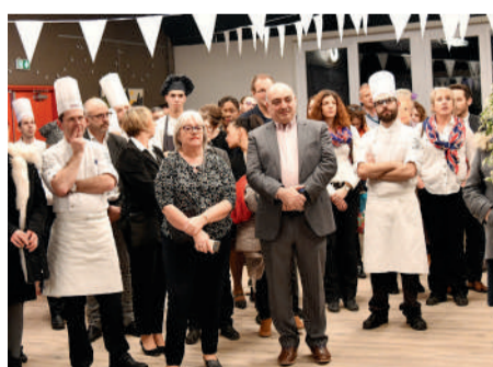
Le lycée Charles de Gaulle ▶ 30 ans déjà !