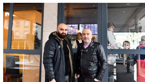
"Tacos School" restauration rapide, 2 rue de Normandie.