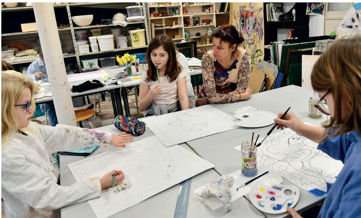
Les plus jeunes peuvent s'initier très tôt aux différentes disciplines proposées au sein de l'école des Beaux-Arts.

de techniques d'impression comme la linogravure. Ces enseignements sont accompagnés d'exemples et de découvertes d'artistes ou d'oeuvres de l'histoire de l'art.