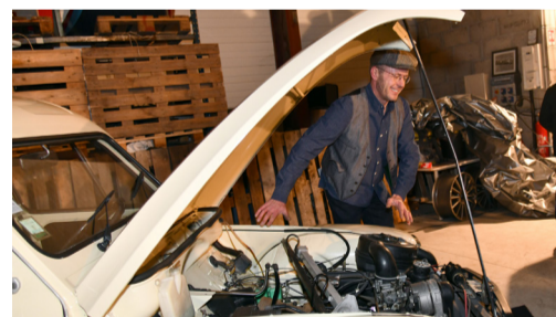
"Garage du Compiégnois", 6 rue Jacques de Vaucanson.