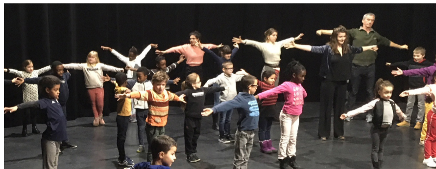
Des répétitions ont lieu à l'Espace Jean Legendre, pour que les enfants puissent se familiariser avec la scène.