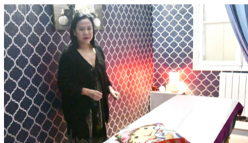
"L'étoile bleue", salon de massage et de relaxation, 7 rue des Boucheries.