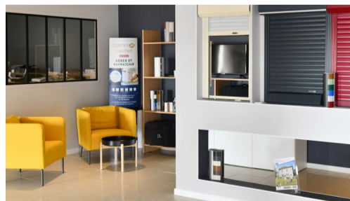
"Monsieur Store", 9 avenue de Flandres Dunkerque.