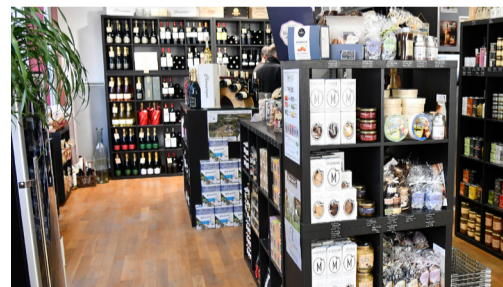
"Le 132", Bar à vin, épicerie fine avec dégustation, rue de l'Étoile.