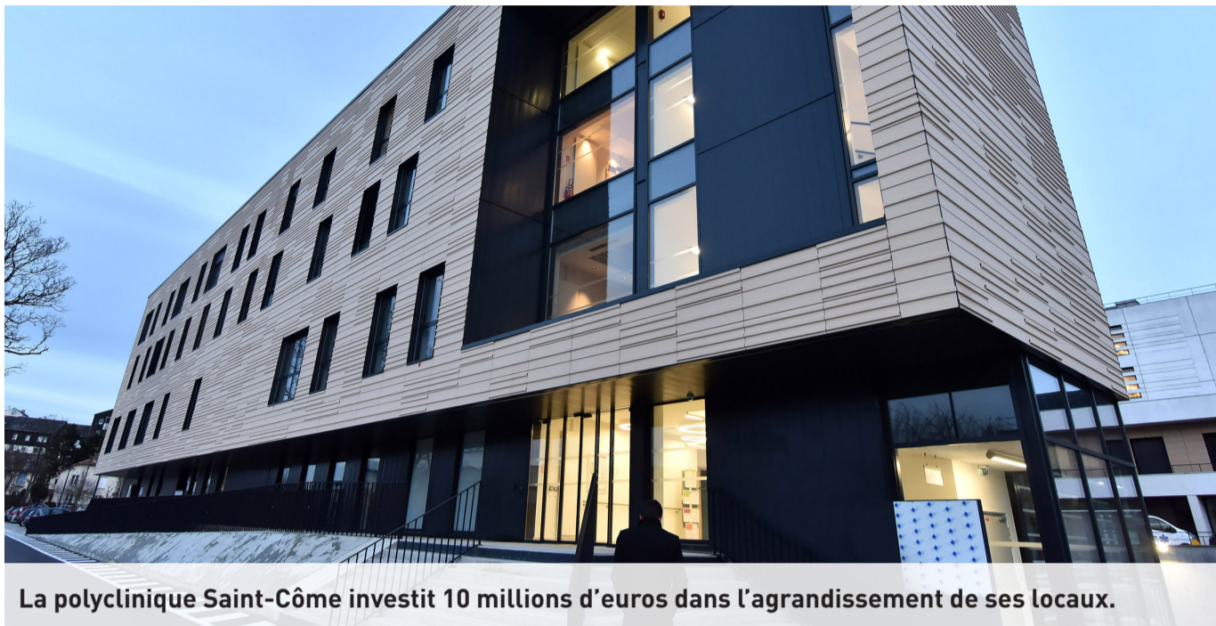
La polyclinique Saint-Côme investit 10 millions d'euros dans l'agrandissement de ses locaux.