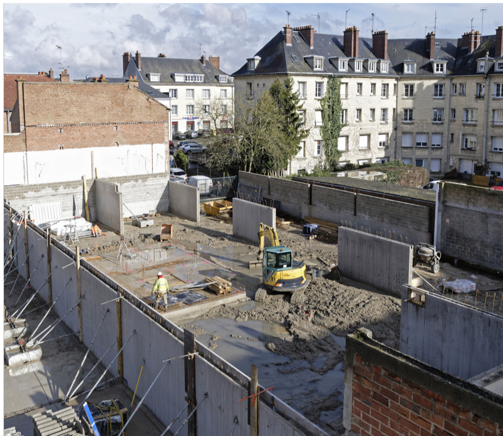
Travaux du square Acary, rue d'Amiens, dans le quartier du Petit Margny.

Après la place du Change, c'est au tour du square Accary, rue d'Amiens au Petit Margny de bénéficier du programme « Action Cœur de Ville ».