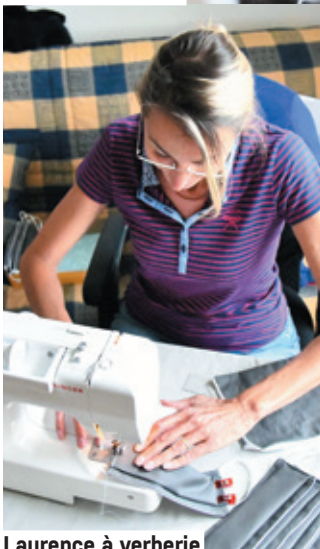
Laurence à verberie

Des dizaines de bénévoles dans une vingtaine de communes de l'agglomération ont réalisé des masques à partir des kits à coudre achetés par l'ARC. Leur apport a été déterminant pour livrer au plus vite. Un grand merci !