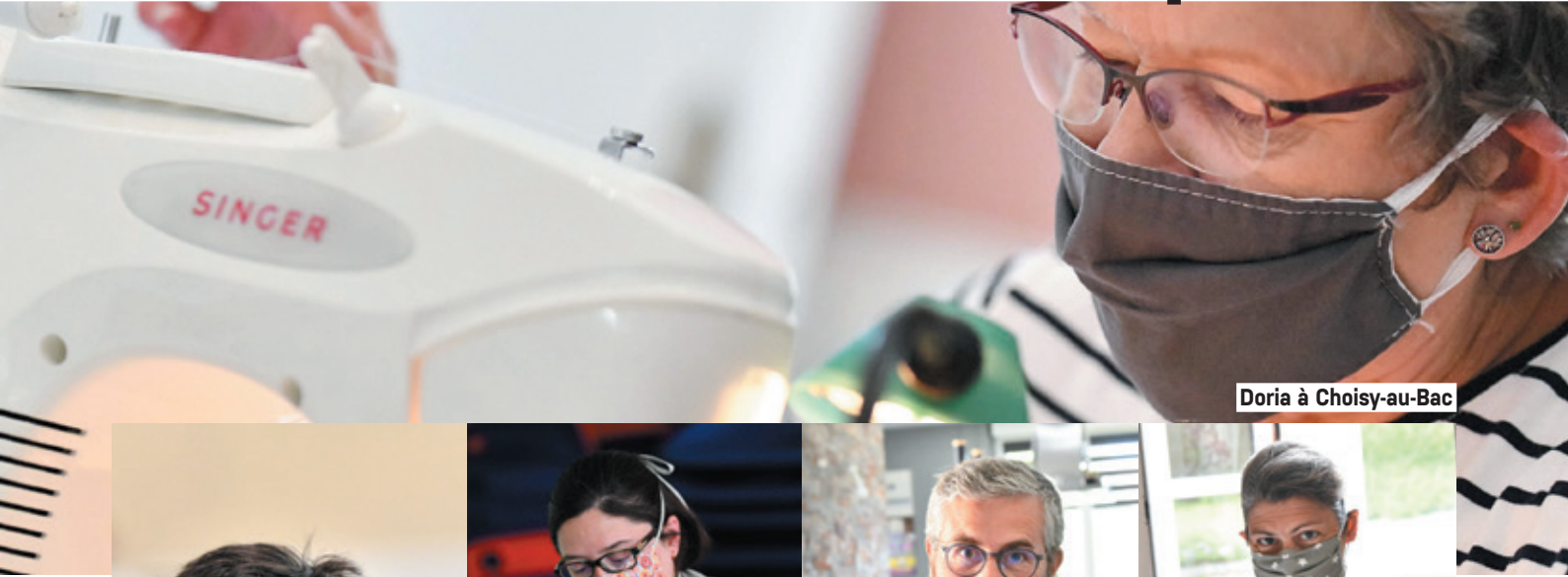
Doria à Choisy-au-Bac