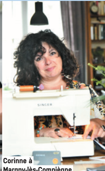
Corinne à Margny-lès-Compiègne