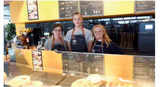
Colombus Café & Co, centre commercial des Grands Chemins à Royallieu, coffee shop.

Co-directeur de la publication : Philippe Marini - Co-directeur de la publication : Françoise Trousselle Réalisation : Service communication (Ville de Compiègne) - Photographes : Edouard Bernaux / Richard Dugovic / Jonathan Coelho / DR Impression : Imprimerie de Compiègne - Régie publicitaire : LVC Communication - Tél. 06 11 59 05 32