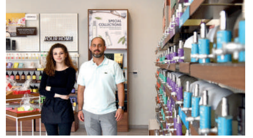
Equivalenza, centre commercial des Grands Chemins à Royallieu, parfumerie et produits de beauté.