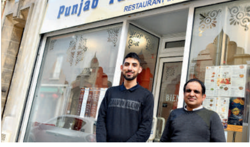
Punjab Tandoori, 35 rue Vivanel, restaurant indien et pakistanais.