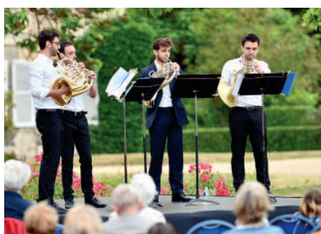
◀ Le Festival des forêts offre un superbe moment musical avec l'ensemble de cors « Horn to Be » dans le parc du Haras national.

Sonorisation, les parapluies multicolores ▶ aux couleurs de la ville ont donné un air de fête aux rues piétonnes tout l'été.