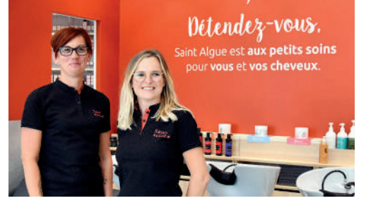
Saint-Algue, centre commercial des Grands Chemins à Royallieu, salon de coiffure.