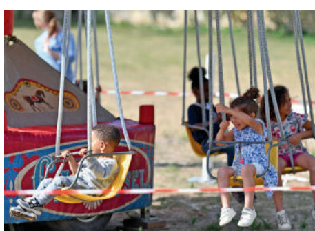
◀ Compiègne Parc a ravi petits et grands au Parc de Bayser pour un été plein de surprises.

Les centres de loisirs ▶ ont accueilli cette année près de 600 petits Compiégnois en toute sécurité.