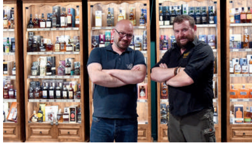
V and B, centre commercial des Grands Chemins à Royallieu, magasin de vins et spiritueux.