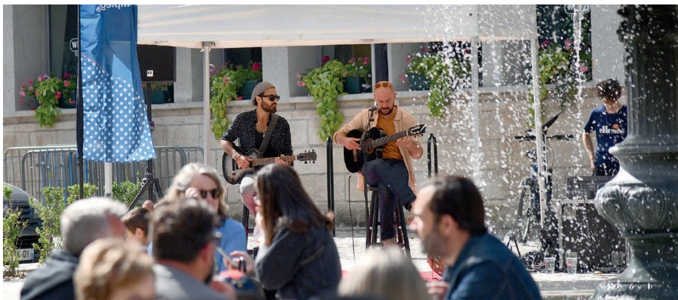
Festival d'été. Animations musicales et théâtrales ont animé le centre-ville pour le plus grand plaisir des badauds.