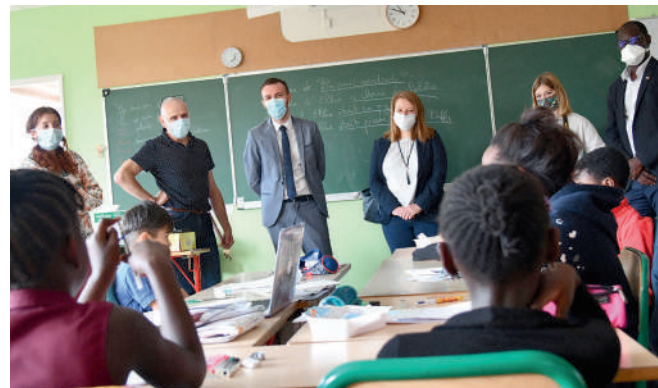
Opération Vacances apprenantes.

Le dispositif « Vacances apprenantes » a été étendu cette année à l'ensemble des élèves.