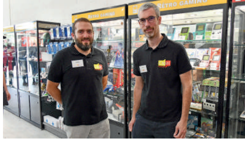
Cash Compiègne, centre commercial des Grands Chemins à Royallieu, achat-vente de produits d'occasion.