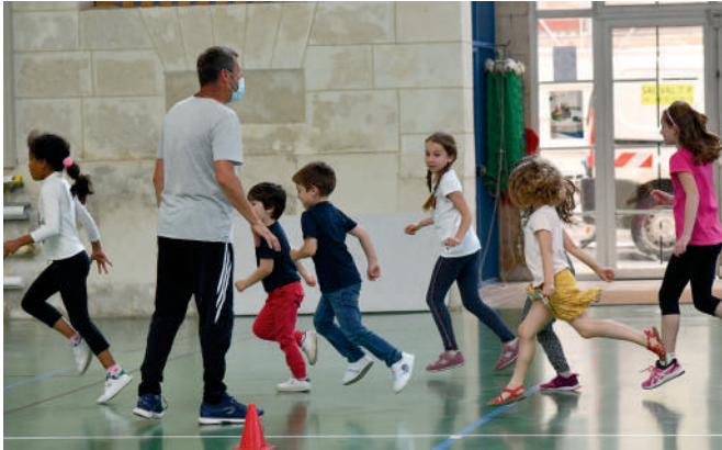
Une convention a été signée fin juin entre l'Education nationale et la Ville de Compiègne pour officialiser l'accueil des élèves sur le temps scolaire.

Educateurs sportifs, animateurs des centres municipaux, personnels des bibliothèques et des musées, jardiniers, ATSEM et personnel des crèches de la Ville ont ainsi été détachés pour assurer et animer ces accueils, dans le respect des mesures de distanciation physique.