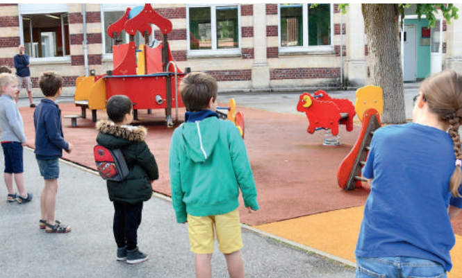
Compiègne a été l'une des premières villes du département de l'Oise à ouvrir ses écoles et services de restauration dès le 14 mai.

Il en sera de même pour la rentrée. Si la situation sanitaire l'exige de nouveau en septembre, la Ville de Compiègne, en lien étroit avec l'Education nationale, fera le nécessaire pour que enseignants, enfants et agents municipaux puissent travailler dans des conditions sanitaires optimales ».