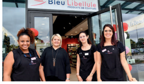
Bleu Libellule, centre commercial des Grands Chemins à Royallieu, produits et accessoires de beauté.