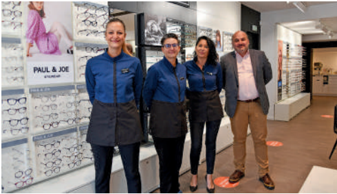
Grand Optical, 12 place de l'Hôtel de Ville, optique.