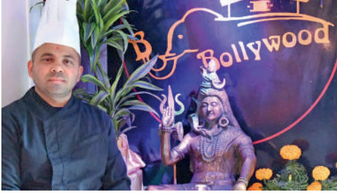
B Bollywood, 10 rue des Boucheries, restaurant indien.