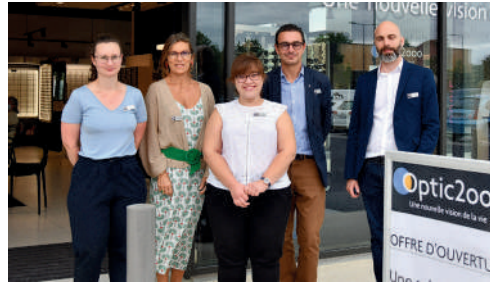
Optic 2000, centre commercial des Grands Chemins à Royallieu, optique.