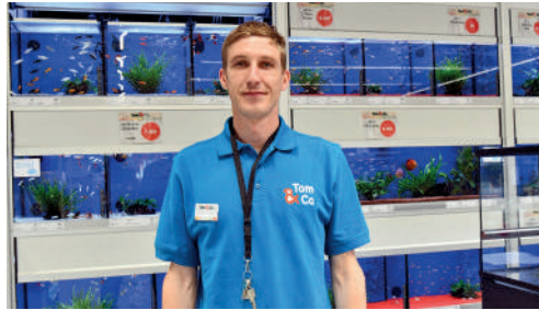
Tom & Co, centre commercial des Grands Chemins à Royallieu, animalerie.