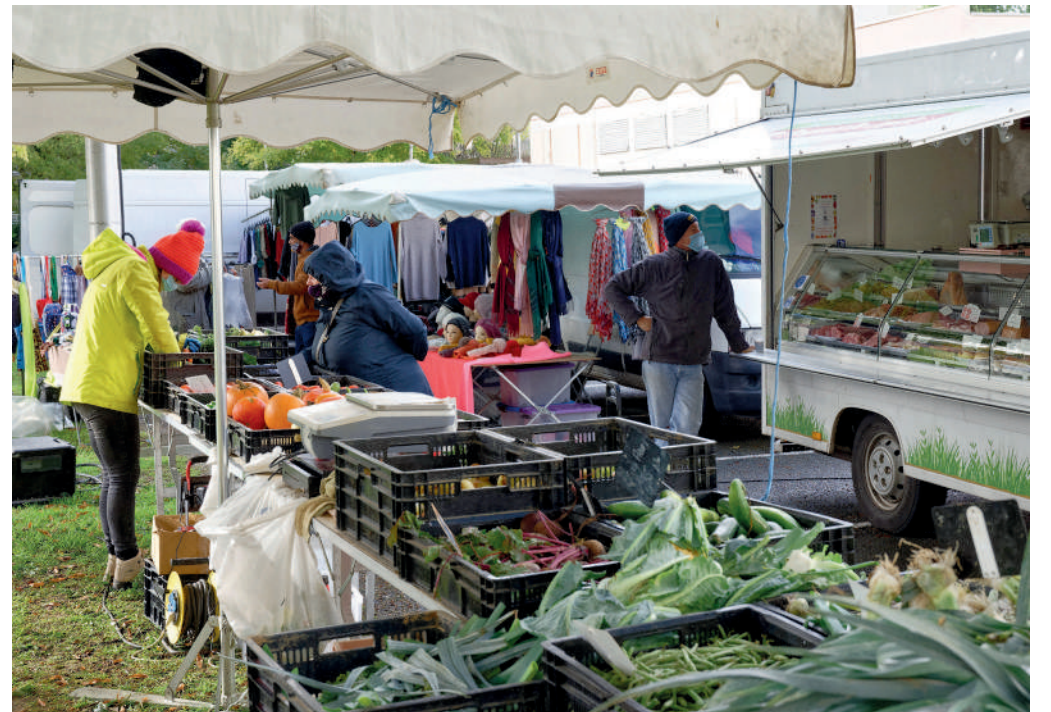
Le marché Pompidou accueille actuellement six commerçants non sédentaires.

rue Philéas Lebesgue : mercredi de 8h à 13h30.