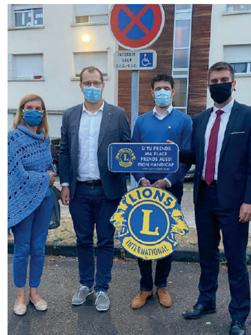
La Ville de Compiègne dispose actuellement de 350 places de stationnement pour personnes à mobilité réduite, dont 40 dans l'hyper centre-ville.

Alors les places réservées, on n'y stationne pas, même pour une minute ! ■