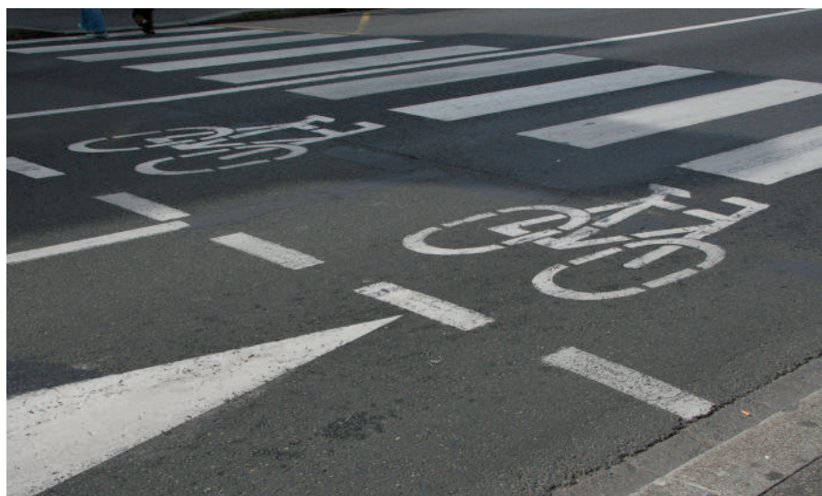
Des "sas vélo" seront aménagés pour protéger les cyclistes aux carrefours.

Dans le même esprit de faciliter la vie des cyclistes, dès le début janvier, le tourne à droite au feu tricolore sera instauré. Il permet au vélo le dégagement immédiat à droite, même si le feu tricolore est au rouge. Les panneaux ad'hoc seront installés dans le même rythme que le marquage des sas.