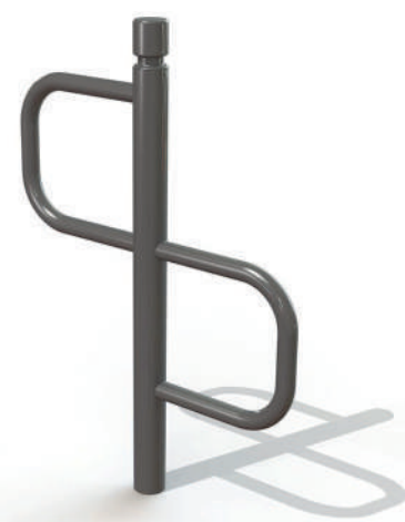
Le S de stationnement.

Dès 2021, il a été décidé que tout remplacement de « potelet » serait l'occasion de mettre un S permettant d'attacher son vélo. Ce type de mobilier urbain permet de répondre aux besoins diffus des cyclistes qui souhaitent pouvoir stationner leur bicyclette partout dans Compiègne. Ces remplacements prendront une cadence systématique, l'ensemble des quartiers sera progressivement équipé. Pour les pôles d'attractivité, c'est-à-dire les secteurs attirant beaucoup de personnes, des abris-vélos seront aménagés. Sur les deux années à venir, 2021 et 2022, 16 abris seront réalisés permettant de garer 96 vélos en toute sécurité. ■