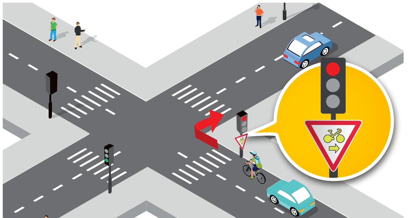
Le tourne à droite au feu rouge sera autorisé uniquement pour les vélos.

D'ores et déjà Compiègne met son centre historique en ordre de bataille pour faire des circulations douces une réalité dès le début de l'année.