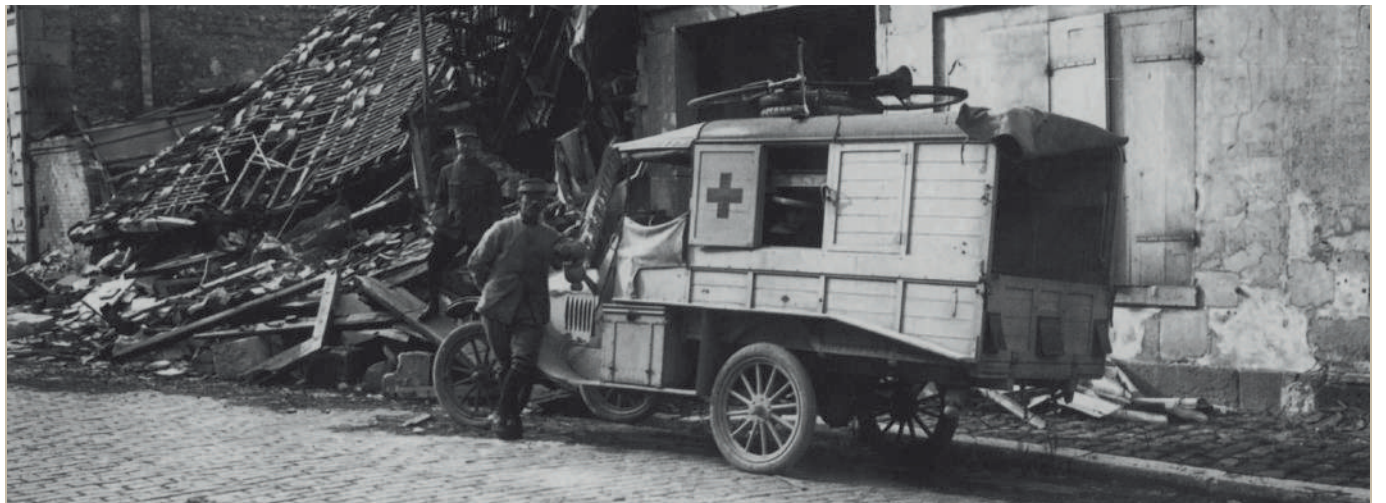
Le Service de Santé des Armées, toujours au plus près des combats, intervient aussi lors de crises sanitaires exceptionnelles.

La capacité d'organisation et la réactivité face à un afflux massif de blessés font effectivement partie de l'ADN du SSA, un savoir-faire que ce dernier a mis en œuvre sur le territoire national au moment des attentats. ■