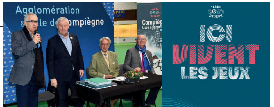
En novembre 2019, Compiègne et l'ARC étaient labellisées "Terre de Jeux 2024".

Des groupes de travail vont être organisés avec les acteurs économiques et touristiques pour élaborer une offre globale. Nous ferons ensuite du lobby via des contacts extérieurs et les fédérations. Compiègne pourra espérer des retombées économiques et touristiques grâce à l'événement sportif le plus regardé au monde. ■