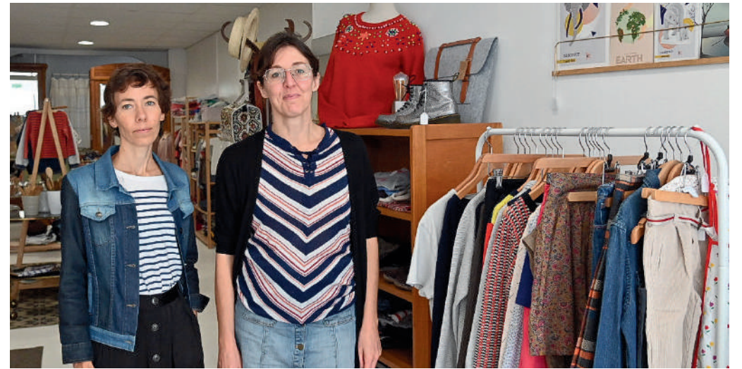
Une 1 ère boutique à l'essai vient d'ouvrir ses portes à Compiègne, rue de Pierrefonds.

Conçue sur le principe d'un concept store, la nouvelle boutique à l'essai, située rue de Pierrefonds, accueille depuis septembre dernier deux enseignes, Idely et Lulufripette, qui proposent une offre de produits écoresponsables.