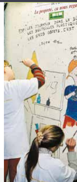
Le tri sélectif a été mis en place en 1999, avec une campagne de sensibilisation.