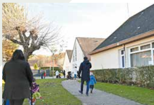
L'école des Linières de Choisy-au-Bac a été créée en 1983 grâce au SIVOM. Elle a été réalisée au centre d'un lotissement intercommunal de 380 logements.

L'intercommunalité a financé de nombreux équipements publics avec, à titre d'exemples, la halle des sports Marcel-Guérin et la médiathèque Jean Moulin (à Margny-lès-Compiègne), les écoles à Armancourt, Venette et Janville.