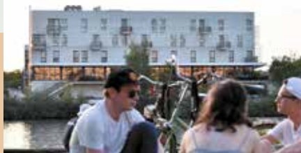
Le secteur du Pont Neuf dans les années 1990.