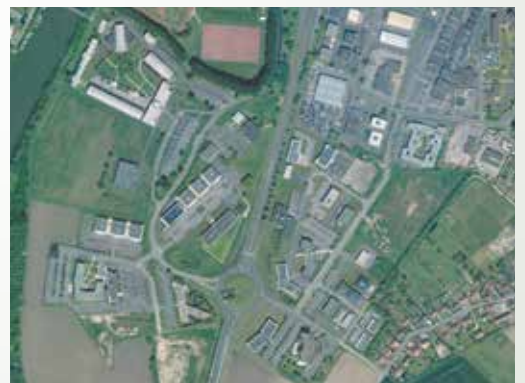
Le parc Tertiaire et scientifique en 2006 (en haut), 2013 et 2018.