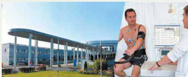
L'ARC ACCOMPAGNE LES INVESTISSEMENTS DU CENTRE HOSPITALIER DE COMPIÈGNE-NOYON

Le Conseil d'agglomération a voté une subvention d'équipement de 10 000 € en faveur du centre hospitalier pour boucler le financement d'un équipement "VO2 max". Cet appareil détermine les capacités cardiorespiratoires. Il aidera par exemple à détecter les patients menacés d'arrêt cardiaque.