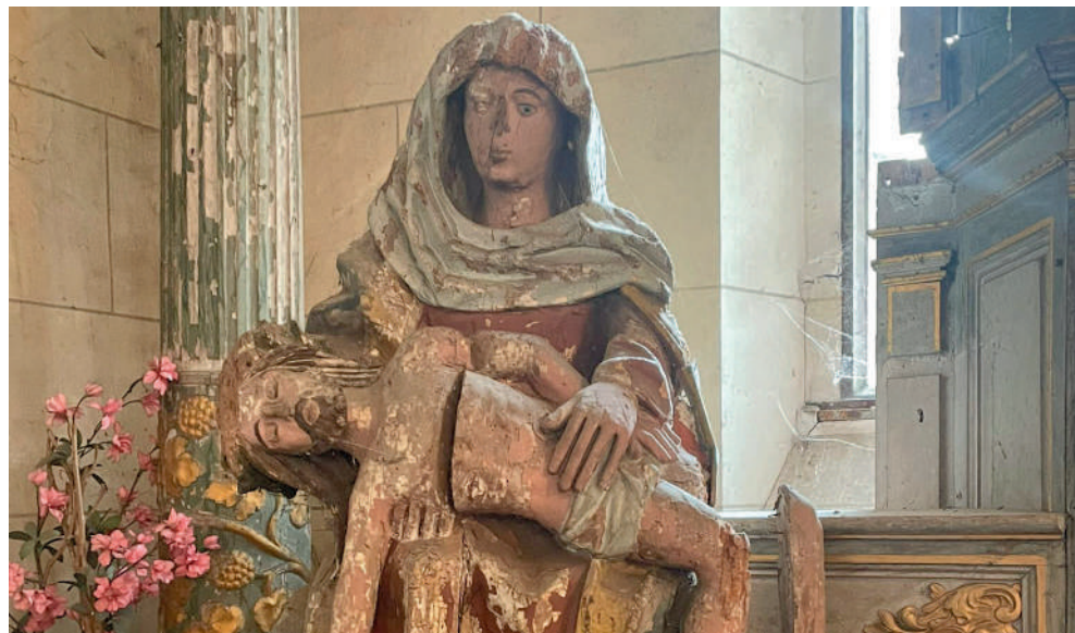
La Vierge de Pitié conservée à Ville sera restaurée prochainement, grâce au vote des lycéens de Charles de Gaulle.

En mai dernier, les élèves de seconde 2 du lycée Charles de Gaulle de Compiègne votaient pour l'une des œuvres d'art du département sélectionnées dans le cadre du Plus grand musée de France. L'œuvre choisie par les lycéens, la Vierge de Pitié conservée dans l'église de Ville, bénéficiera ainsi de 10 000 € pour sa restauration.