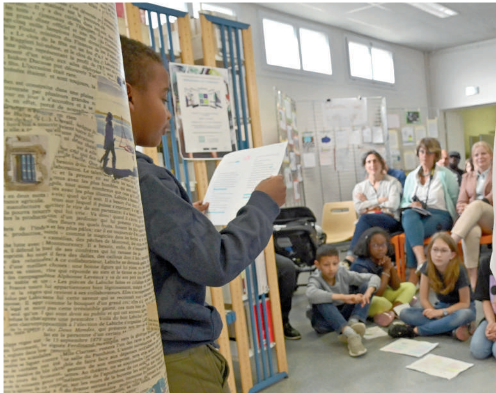
Les élèves de l'école Augustin Thierry et les familles assistent à la présentation du CLÉA "La fabrique à histoires".

En 2022, le Contrat Local d'Éducation Artistique évolue pour s'ouvrir dès la rentrée de septembre à toutes les communes de l'ARC et également à tous les publics.