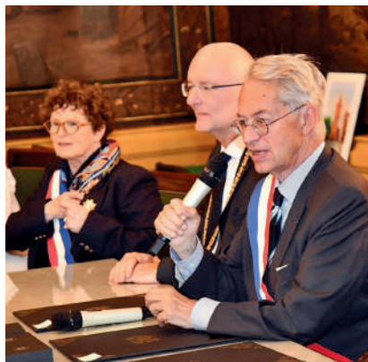
Discours suivis de la signature des chartes anniversaires.

Les échanges virtuels et épistolaires avec nos villes amies ont bien sûr été maintenus pendant la pandémie de Covid19. Si nos associations de jumelage ont été présentes dans la ville à travers le "village des jumelages" lors de la fête des associations et si le Tour de table des jumelages a permis aux membres des associations de se retrouver pour un moment convivial, cela faisait deux ans que la ville de Compiègne n'avait pas pu accueillir les représentants de ses villes jumelles. C'est avec une joie réciproque que ce week-end de mai a permis nos retrouvailles avec des amis de longue date.