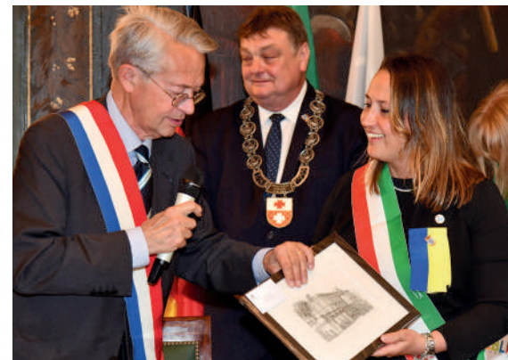
Échanges de cadeaux.