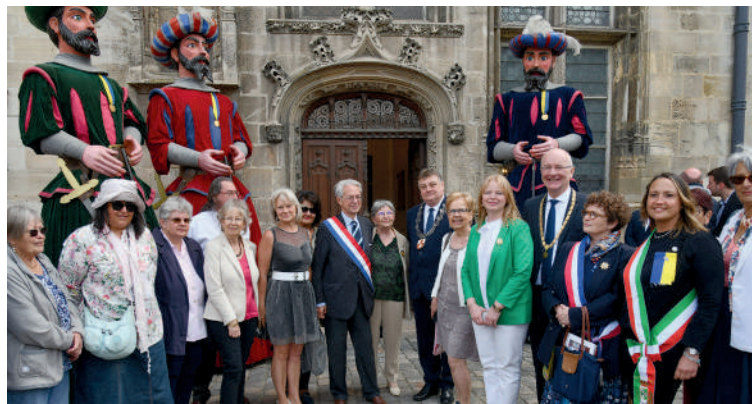
Les élus et membres des associations de jumelage de Compiègne accueillent les délégations étrangères.

Trois anniversaires de jumelage ont été célébrés à Compiègne, le dernier week-end de mai, en présence des délégations venues de nos 3 villes jumelles.