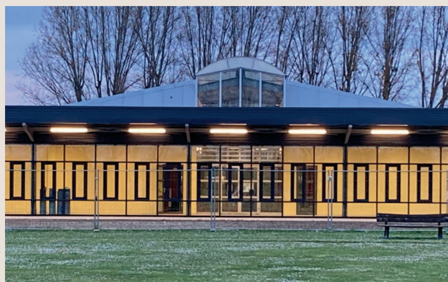
Les nouvelles installations du Centre de tir à l'arc seront inaugurées samedi 1 er octobre.

Les nouvelles installations seront inaugurées le samedi 1 er octobre en présence de sportifs de haut niveau venus disputer le Grand Prix de l'ARC.