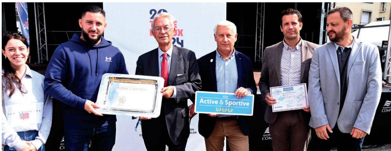
Remise du label Ville Active et Sportive - 3 lauriers à la Ville de Compiègne, lors de la Fête des associations.

Ville Active et Sportive depuis 2018, Compiègne vient de se voir attribuer 3 lauriers, un niveau de labellisation qui récompense la ville pour ses actions en faveur du sport pour tous, tant en matière de développement de ses équipements et espaces dédiés au sport, que pour ses initiatives en faveur de la promotion d'une pratique sportive et ludique sous toutes ses formes et accessible au plus grand nombre.