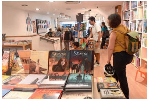
Librairie des Signes « L'annexe », 15 rue de l'Etoile. BD - Manga.