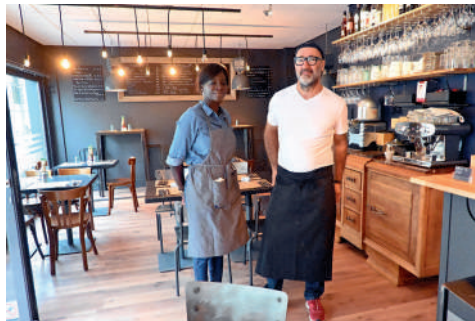
La Cantina, 4 rue des Boucheries. Restaurant - Spécialités Italiennes.