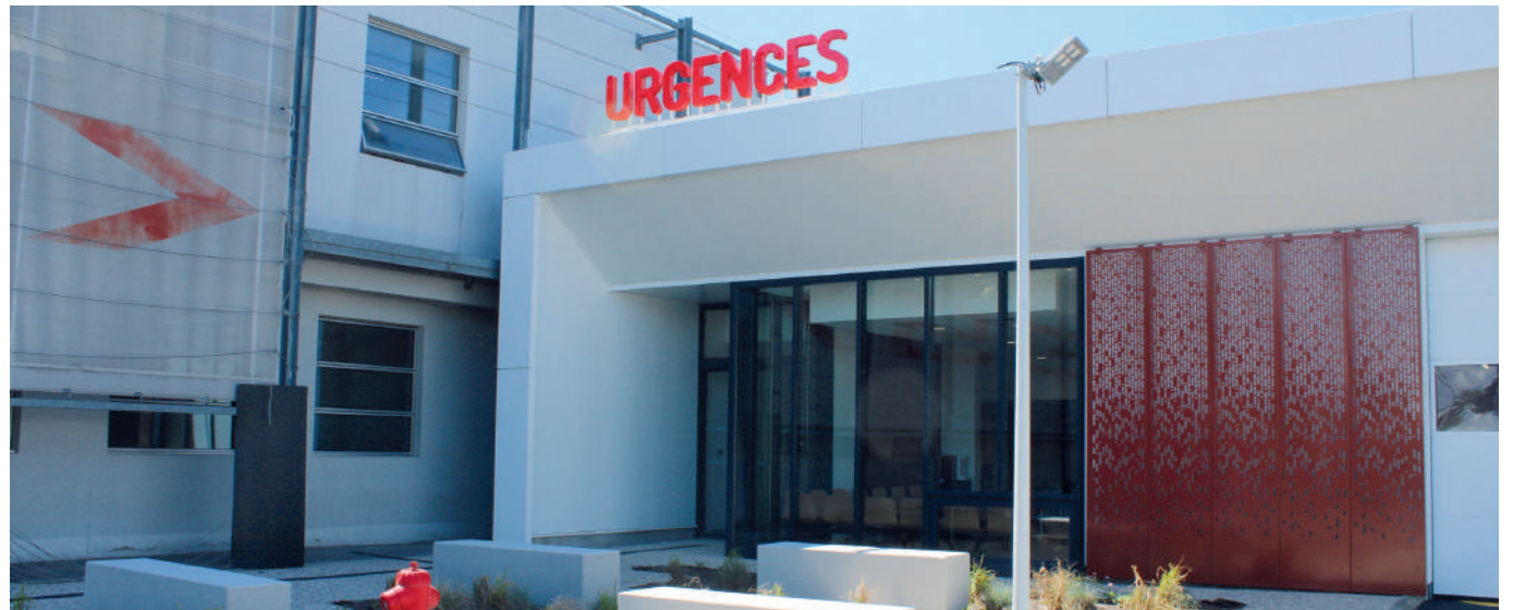
Les nouvelles urgences du centre hospitalier Compiègne-Noyon accueillent près de 77 000 patients chaque année.

Enfin, l'équipe du SMUR, rattachée au service des urgences de l'hôpital, bénéficie également d'un nouveau bâtiment composé entre autres d'un espace pour les conducteurs ambulanciers ainsi que d'un garage où les véhicules d'intervention seront stationnés et réapprovisionnés.