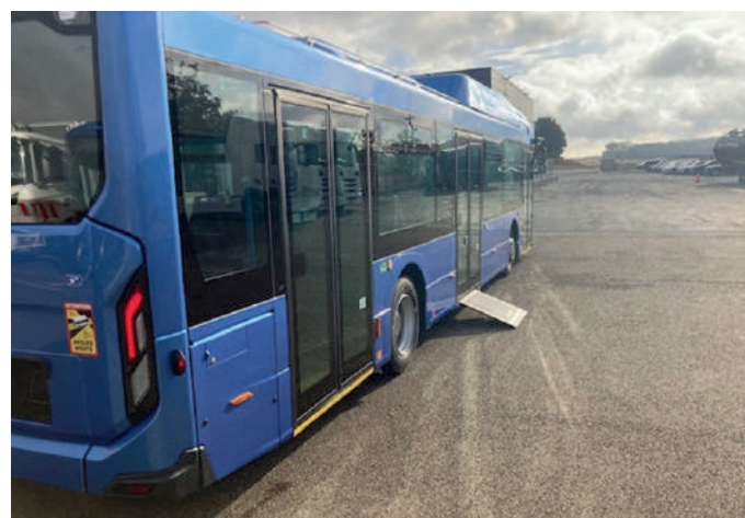
24 bus du réseau de transports urbains sont dotés de planchers bas.

A Compiègne, 20 arrêts de bus sont aux normes d'accessibilité.