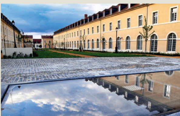
La cour d'Orléans.

Particulièrement vigilante au respect des lieux chargés d'histoire, la Ville de Compiègne ne peut que se réjouir des programmes de grande qualité réalisés sur le site de l'école d'état-major.