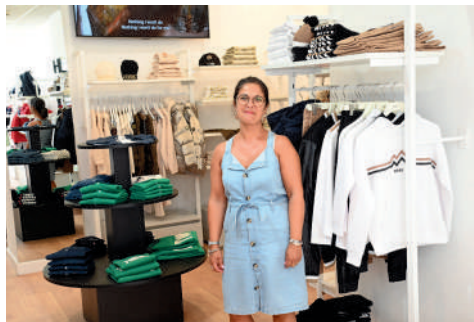
Honor Kids, 5 rue de la Corne de cerf. Prêt-à-porter enfants