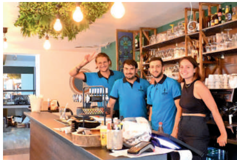
Restaurant La fontaine, 20 rue de l'Etoile.