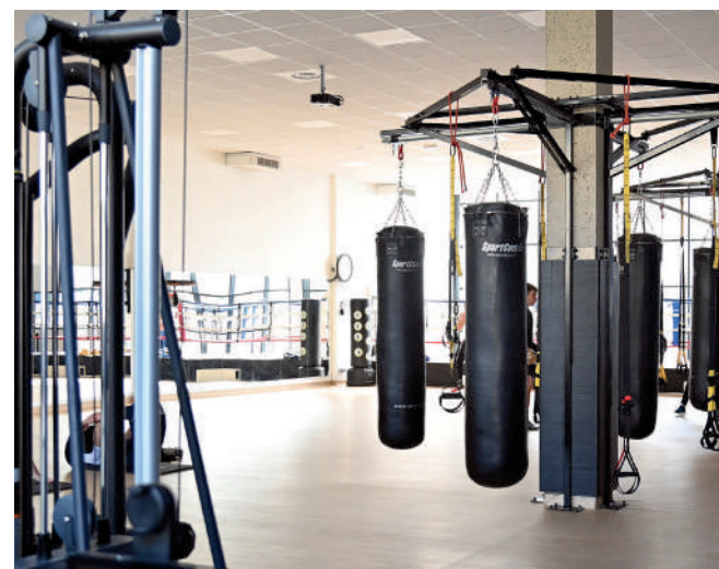
Stade équestre du Grand Parc, salle d'escrime, salle de boxe Jacques Vasset, Centre de tir à l'arc, stade Paul Petitpoisson et stade Jouve Senez seront Centres de préparation aux Jeux 2024.

de Préparation aux Jeux, des équipements de la Ville et de l'ARC de haut niveau destinés à l'accueil de délégations étrangères avant les Jeux Olympiques et Paralympiques de Paris 2024.