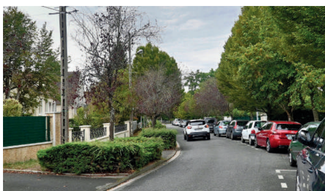
La Ville poursuit l'enfouissement des réseaux, avenue de la Forêt et rue Edouard Dubloc.