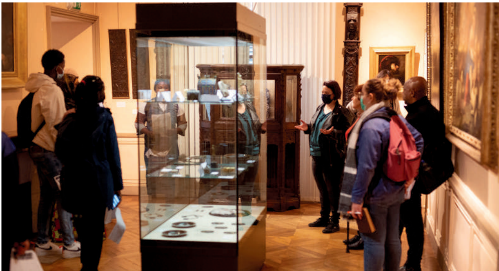
Visite du Musée Antoine Vivenel, avec les apprenants du Centre Ressource Lecture.

L'angle de prise de vue est important, nous a aussi expliqué Marc. Il a « focalisé » sur le visage ou des détails de certaines œuvres alors qu'au musée, on voyait la statue entière ».