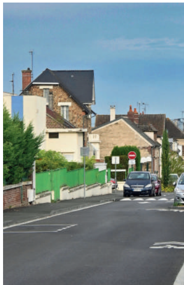
Parmi les principaux chantiers de l'été, ont été réalisés la requalification de la rue de la Glacière, le remplacement du mobilier urbain, l'aménagement de la place Saint-Antoine.