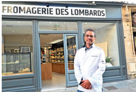
Fromagerie des Lombards, 4 rue des Lombards. Alimentation.