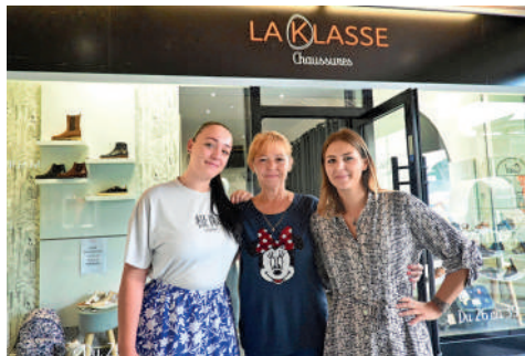
La Klasse Chaussures, 10 rue des Bonnetiers. Magasin de chaussures enfants.