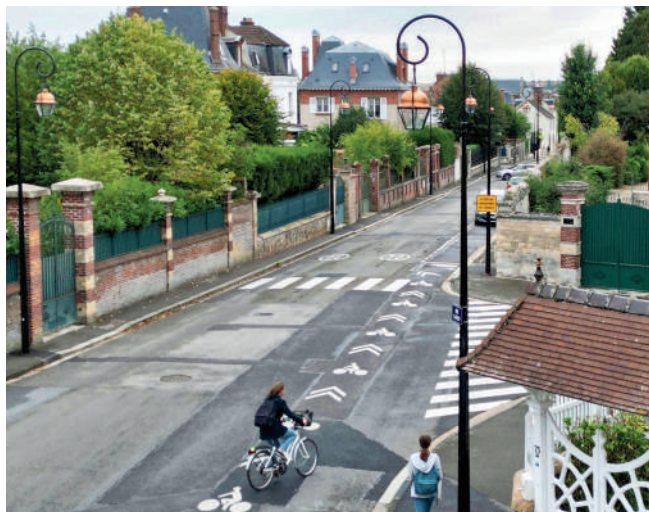
Démarrage des travaux de la dernière tranche de la rue Carnot, au dernier trimestre 2022.

Les travaux de la dernière tranche de la rue Carnot, comprise entre les rues de Clamart et des Réservoirs sur une longueur d'environ 400 mètres linéaires, démarrent fin septembre. Ils permettront de prolonger l'éclairage public actuel en LED. La voirie fera l'objet d'une restructuration permettant d'assurer une meilleure accessibilité des personnes à mobilité réduite par l'élargissement des trottoirs et la mise aux normes des traversées. Le coût de ces travaux est de plus de 600 000 euros TTC.