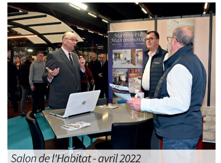
Salon de l'Habitat - avril 2022

Chaque année, des manifestations telles que la Foire-Expo ou le Salon de l'Habitat, contribuent à la promotion de l'économie locale en offrant une vitrine à ses artisans et à ses commerçants.