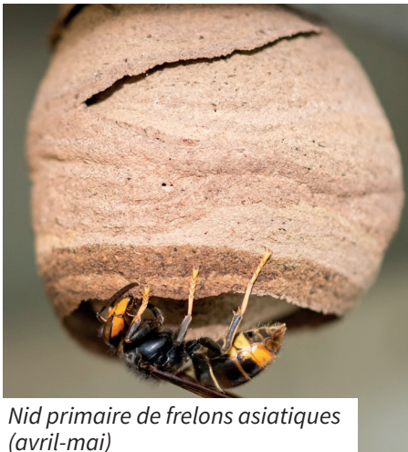
Nid primaire de frelons asiatiques (avril-mai)

Le frelon asiatique est un redoutable prédateur des insectes sauvages et des abeilles domestiques. Un nid de frelons asiatiques consomme, chaque année, 11 kg d'insectes, dont 1/3 d'abeilles.