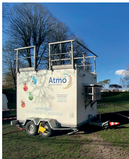
Unité mobile positionnée au Parc de Songeons en 2021

L'association peut également déployer des dispositifs mobiles comme par exemple, au Parc de Songeons à Compiègne où une unité mobile a été présente à 3 reprises au cours de l'année 2021.