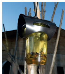
Piège fourni par l'ARC