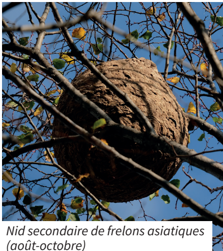
Nid secondaire de frelons asiatiques (août-octobre)

Le frelon asiatique est apparu en France il y a une quinzaine d'années. Resté longtemps au sud de la Loire, il envahit désormais la totalité du territoire français. Alertée par les apiculteurs locaux, l'Agglomération de la Région de Compiègne lance une seconde campagne de piégeage pour lutter efficacement contre ces prédateurs.