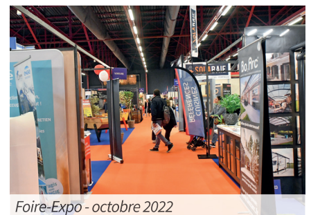
Foire-Expo - octobre 2022

Après une période de pandémie, un élan retrouvé va marquer l'année 2023, avec une programmation variée, concerts, humour, théâtre, Christophe Willem, les Goldmen, Mickaël Grégorio, Elodie Poux, Renaud, Manu Payet, Alban Ivanov, « Un couple magique ». Cette année, Le Tigre accueille également de nouveaux salons tels que le Salon des Loisirs Créatifs, les 3, 4 et 5 mars 2023.