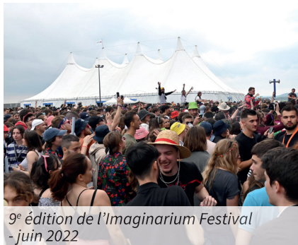
9 e édition de l'Imaginarium Festival - juin 2022

Certains rendez-vous phares du compiégnois ont pris attache au Tigre. C'est le cas de l'Imaginarium Festival, qui produit cette année la 10 e édition de son festival de musique, créé et organisé par des étudiants de l'Université de Technologie de Compiègne.