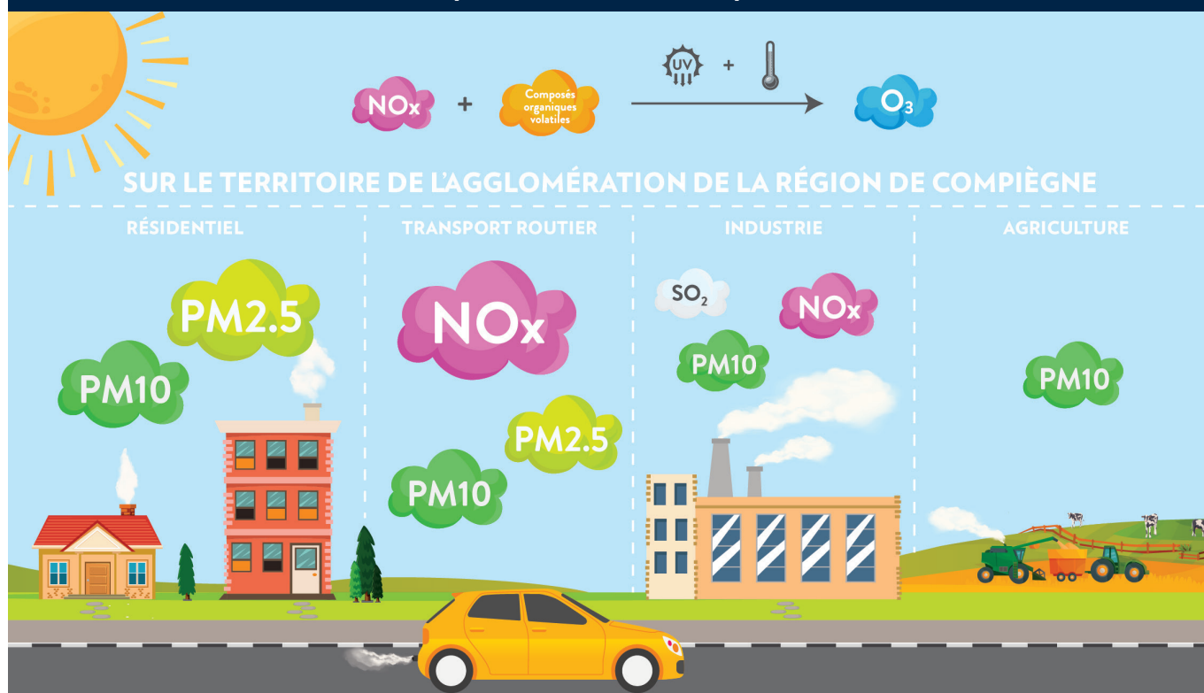
Schéma de la répartition sectorielle de 5 polluants sur l'ARC