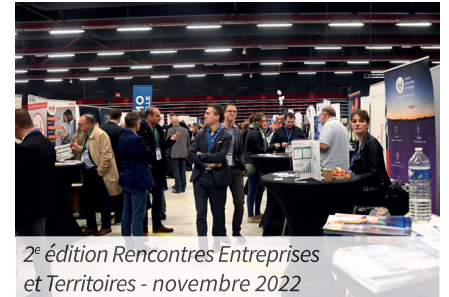
2 e édition Rencontres Entreprises et Territoires - novembre 2022

Alors que la seconde édition des Rencontres Entreprises et Territoires a attiré plus de 1 000 visiteurs, le rendez-vous est pris le 23 novembre 2023 pour une 3 e édition. Cet événement majeur du compiégnois regroupe tous les acteurs économiques de notre territoire, entrepreneurs, élus et techniciens de collectivité. Cette journée est donc propice aux échanges afin de développer, de manière collective, l'activité économique du territoire.