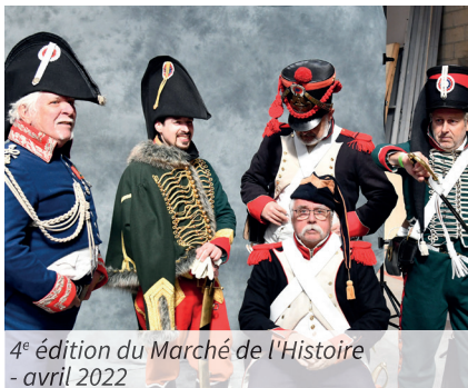
4 e édition du Marché de l'Histoire - avril 2022

Le Marché de l'Histoire revient également cette année pour sa 5 e édition. Cet événement rassemble plus de 250 artisans et commerçants de 24 nationalités, tous spécialisés en produits de reconstitution historique.