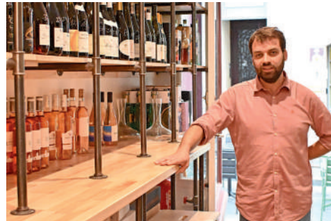
Coteaux et Plateaux, cave et bar à vin, 4 rue des Pâtisseries.