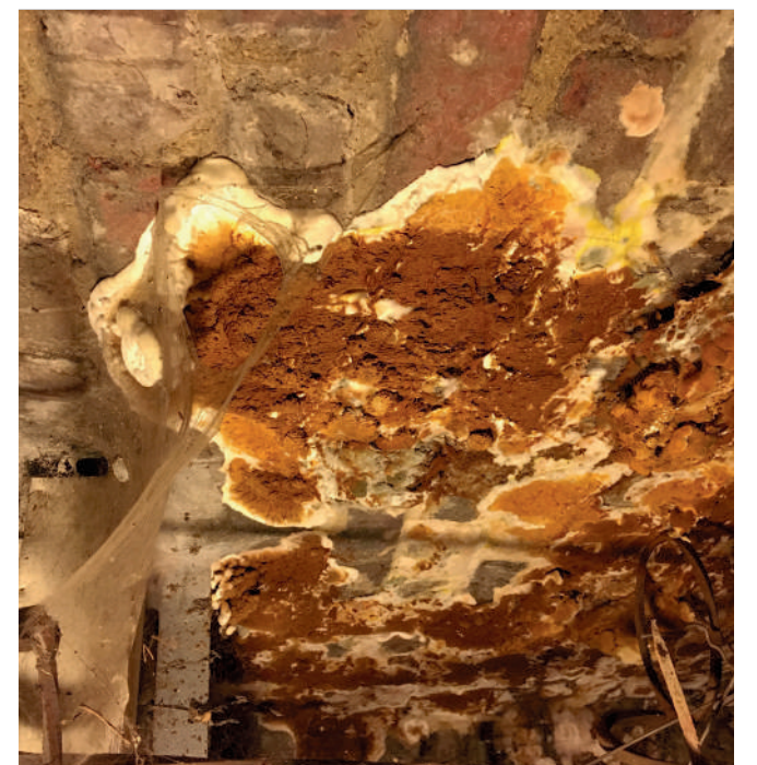
La mэрule, un champignon qui ravage les charpentes et boiseries des bâtiments.