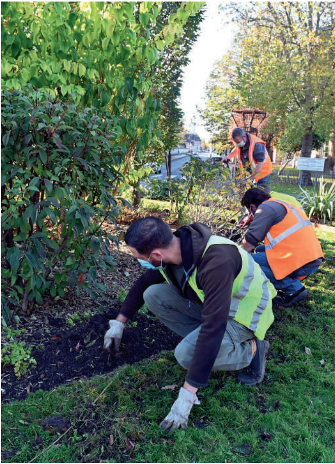
Le service du Patrimoine vert regroupe 46 agents.