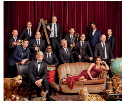
Pink Martini