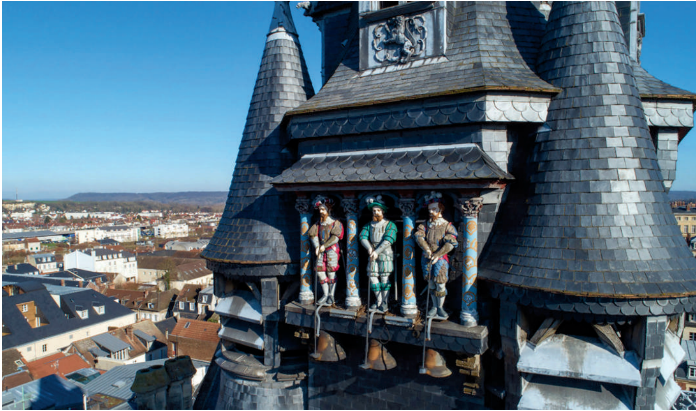
Les Picantins, en cours de restauration.

Depuis fin août, un échafaudage de grande hauteur enveloppe en partie la façade l'Hôtel de Ville. Ce dispositif a été mis en place pour permettre les travaux de restauration des Picantins, les trois personnages emblématiques de la Ville de Compiègne.