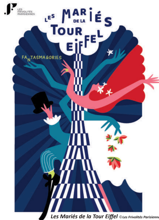
Les Mariés de la Tour Eiffel ©Les Frivolités Parisiennes

➔ Plus d'informations ou réservations des billets : 03 44 40 17 10 / 03 44 92 76 76 ou theatresdecompiègne.com