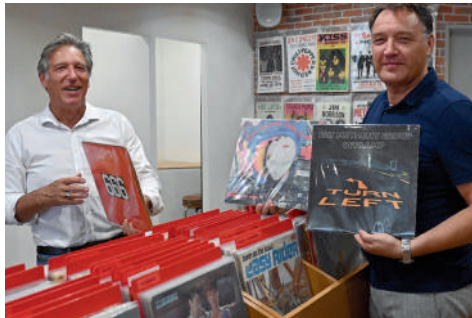
Records Dealer, boutique de vinyles neufs et d'occasion, 28 rue des Lombards.