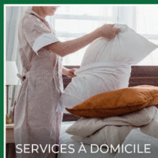
SERVICES À DOMICILE