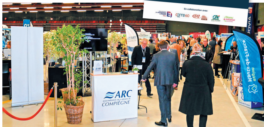
2 e édition des rencontres Entreprises & Territoires, le 24 novembre 2022, à Margny-lès-Compiègne

Depuis 2021, les rencontres Entreprises & Territoires ont battu des records d'affluence en réunissant les acteurs économiques de notre territoire. Pour cette 3 e édition compiégnoise, le jeudi 23 novembre 2023 de 10h à 17h au pôle événementiel du Tigre, Compiègne et son Agglomération innovent avec un espace industrie initié par le Pôle Métropolitain de l'Oise.