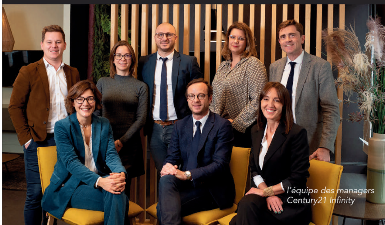
l'équipe des managers Century21 Infinity