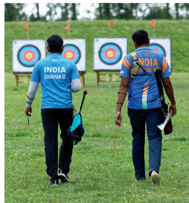
L'équipe de France mais aussi d'autres équipes venues de très loin se sont préparées aux Jeux Olympiques de Paris 2024 à Compiègne. L'Inde et l'Australie en tir à l'arc, mais aussi Cuba en athlétisme et en judo.