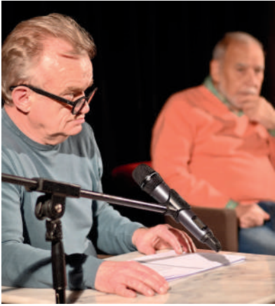
Pour la première édition du festival Paroles , dédiée à la langue française, Dominique Pinon, Tahar Ben Jelloun, Jérôme Garcin et Raphael ont lu, parlé ou chanté la langue à Compiègne.