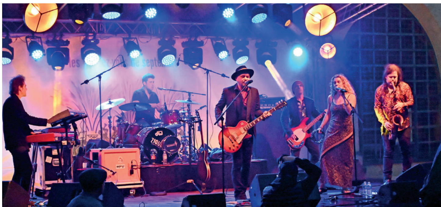
C'est la rentrée, mais c'est encore un peu l'été avec les Rendez-vous de septembre qui prolongent l'ambiance des vacances.