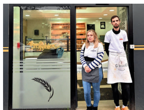
O'Fournil de Paris, 187 rue de Paris. Boulangerie-pâtisserie.