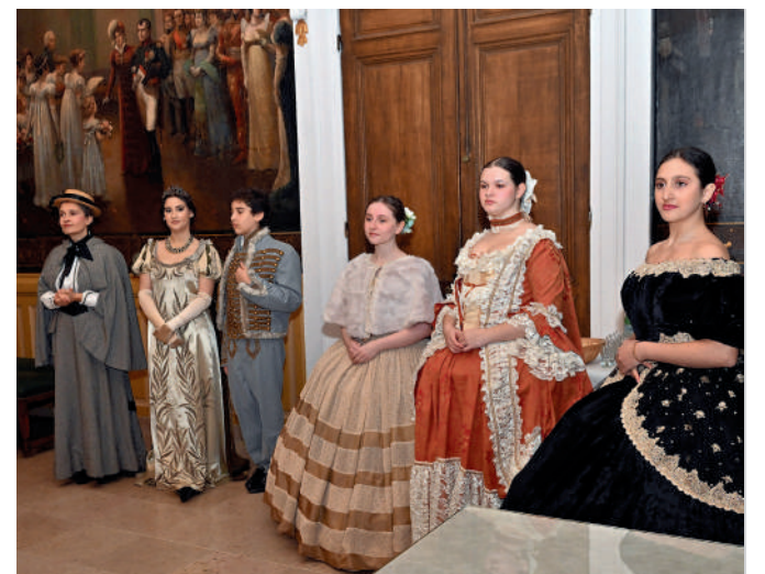
Restitution du projet Paroles d'Histoire menée avec la compagnie Acta Fabula dans le cadre de la Plateforme de Réussite Éducative.