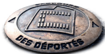
Le Parcours des déportés, désormais matérialisé au sol par 150 clous en bronze entre la gare et le Mémorial de l'Internement et de la Déportation, a été inauguré en présence notamment des élèves des établissements scolaires de Compiègne.