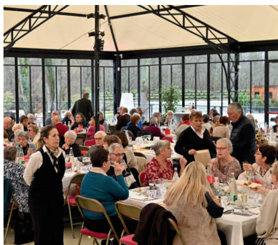
C'est dans l'orangerie du terrain du Grand Parc que nos aînés ont partagé le traditionnel repas de fin d'année.