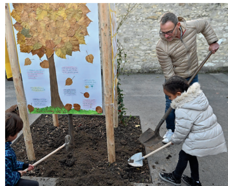
6 arbres ont été plantés dans la cour de l'école Pierre-Sauvage le 25 novembre 2023.