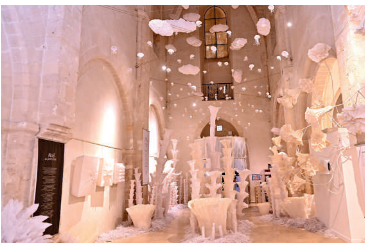
Ambiance onirique à l'Espace Saint-Pierre des Minimes avec l'exposition Noël au Jardin d'Eden , visible jusqu'au 20 janvier 2024.