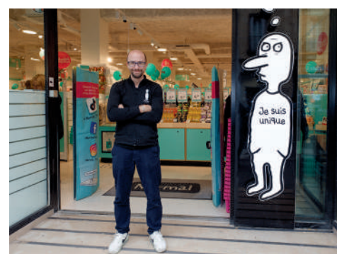
Normal, 23 rue Solferino. Produits d'hygiène et cosmétique, produits d'entretien, papeterie, confiseries et boissons.