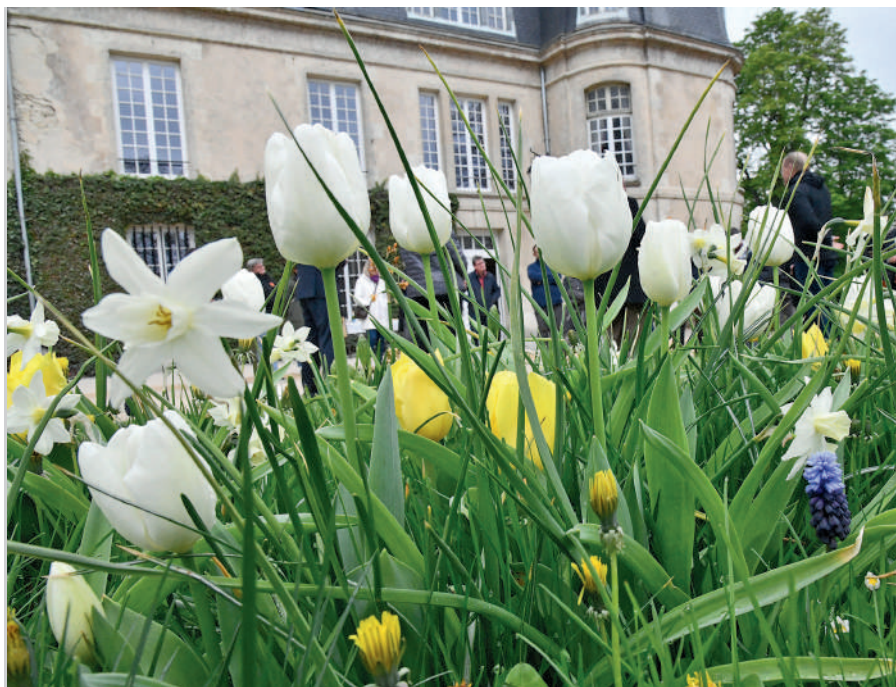
Bonheur de Compiègne, c'est le nom d'un mélange, propre à Compiègne, composé de muscari, narcisse, tulipe ou camassia, vivace sur plusieurs années. Le mélange Ville de Compiègne est composé de 15 bulbes différents dont la floraison s'étale sur 3 mois.