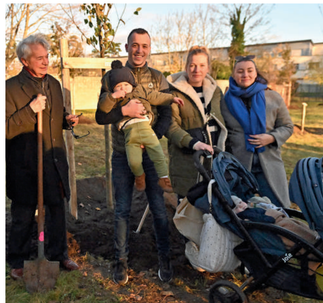
40 jeunes arbres vont prendre racine au Parc de l'abbaye de Royallieu.

Parmi les plantations les plus nombreuses citons 40 arbres au Parc de l'abbaye de Royallieu, 6 arbres à l'école Pierre-Sauvage, 9 à Phileas-Lebesgue et 22 arbres boulevard des États-Unis.