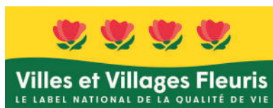
La 4 e fleur prend racine ! Grâce au travail des agents municipaux, Compiègne conserve sa 4 e fleur, le plus haut label des villes et villages fleuris.