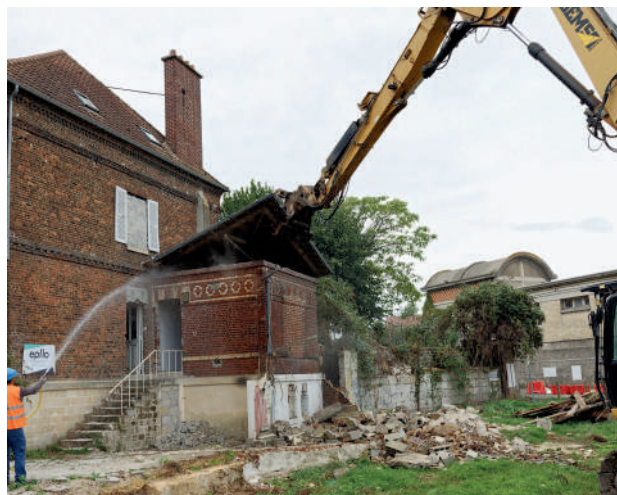
L'EcoQuartier de la gare a commencé avec les premières destructions. Ce vaste chantier, prévu jusqu'en 2035, transformera totalement la rive droite de l'Oise et verra l'implantation de logements, de commerces et de bureaux.