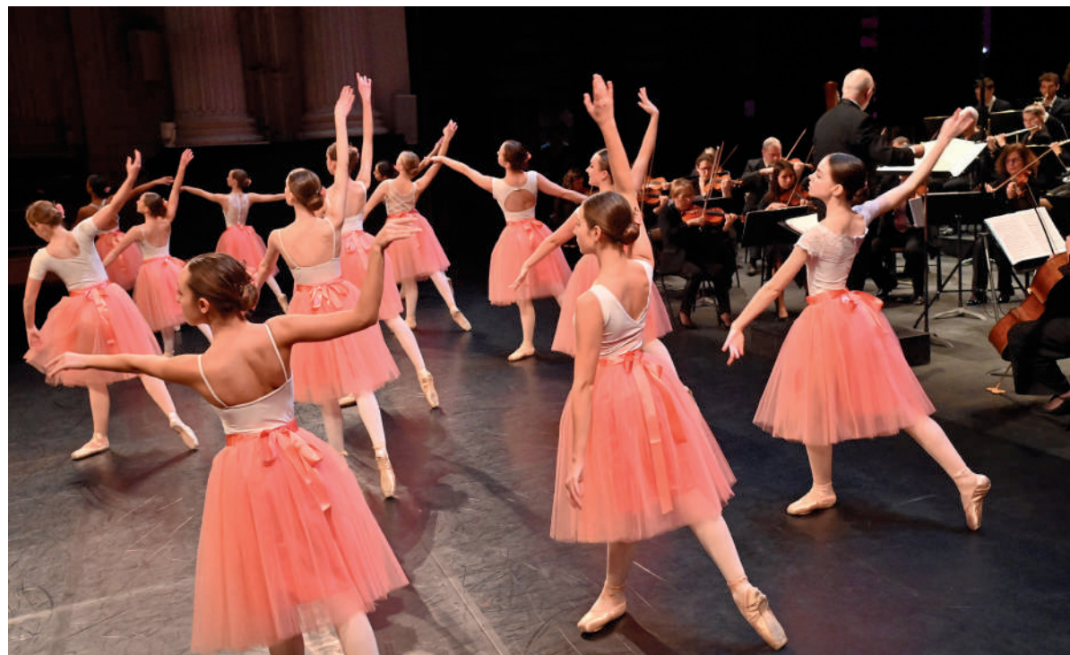
L'année a démarré dans la joie au Théâtre Impérial avec le traditionnel concert du Nouvel An, de l'orchestre Col'Legno, accompagné par les élèves de l'école de danse du Conservatoire et les chorales d'enfants compiégnois.