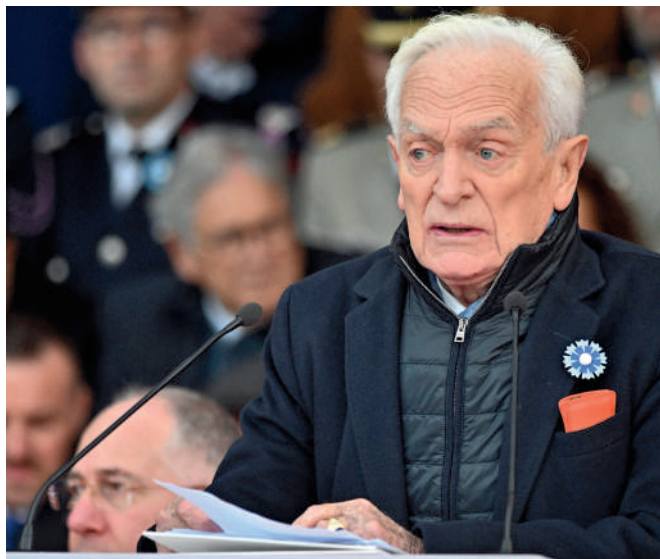
Philippe Labro à la Clairière de l'Armistice le 11 novembre dernier.

Entrée libre (dans la limite des places disponibles)