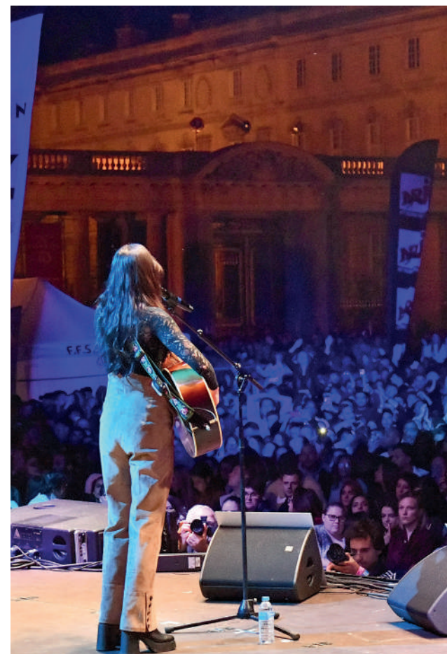
Le NRJ Music Tour a conclu le couronnement de la Reine du Muguet. Louane, Jane et Aya Nakamura ont réuni 20 000 spectateurs face au Château de Compiègne.