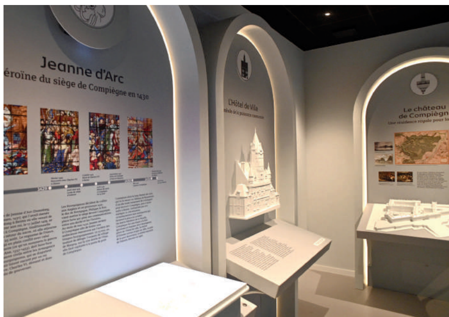
Le musée Vivienel a rouvert au mois de mai, avec une salle supplémentaire, le Site d'Immersion Historique qui nous plonge dans l'histoire et le patrimoine de Compiègne et de sa région.