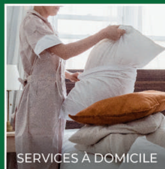
SERVICES À DOMICILE