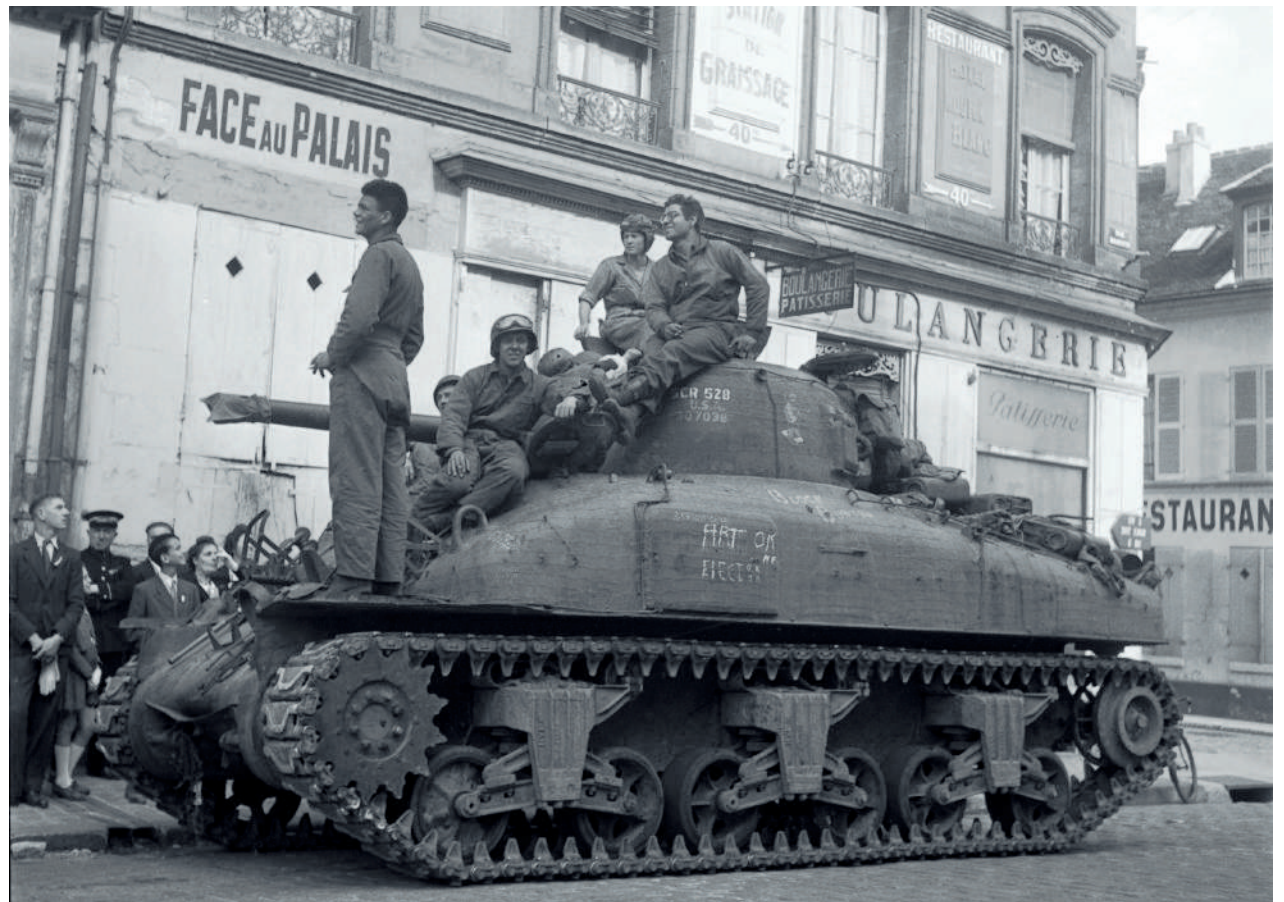
Soldats américains du 70th Tank Battalion, à l'angle de la rue Magenta et de la rue Fourier-Sarlovèze. Cette unité a débarqué à Utah Beach en juin 1944.

Les commerçants situés sur l'itinéraire du défilé sont invités à pavoiser leur commerce avec des drapeaux français.