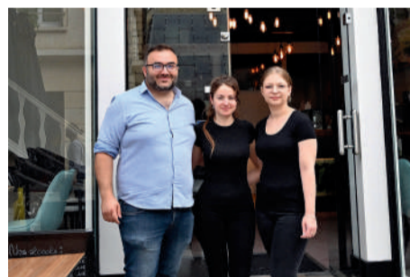
Pastel Café, 3 bis rue Napoléon. Café, glaces et pâtisseries. Brunch le samedi et le dimanche.