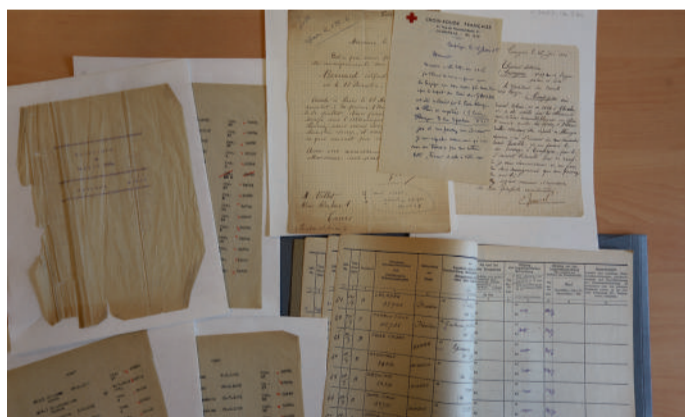
Quelques lettres des familles, la liste nominative du convoi du 2 juillet 1944 et le registre d'infirmerie du camp de Royallieu.

Aucune archive de l'administration du camp de Royallieu n'était connue à ce jour. Le Mémorial de l'internement et de la déportation vient d'en retrouver une partie dans un grenier à Compiègne.