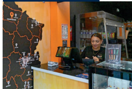
Big M, 12 rue Magenta. Fast food, burgers, wraps et naans burgers.