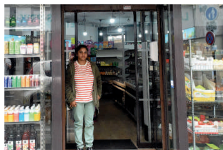
Alena Exotique, 17 rue de l'Étoile. Superette et épicerie exotique.