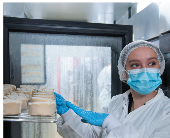
Une exposition avec des témoignages valorisera les métiers de l'industrie auprès des jeunes et des demandeurs d'emploi.