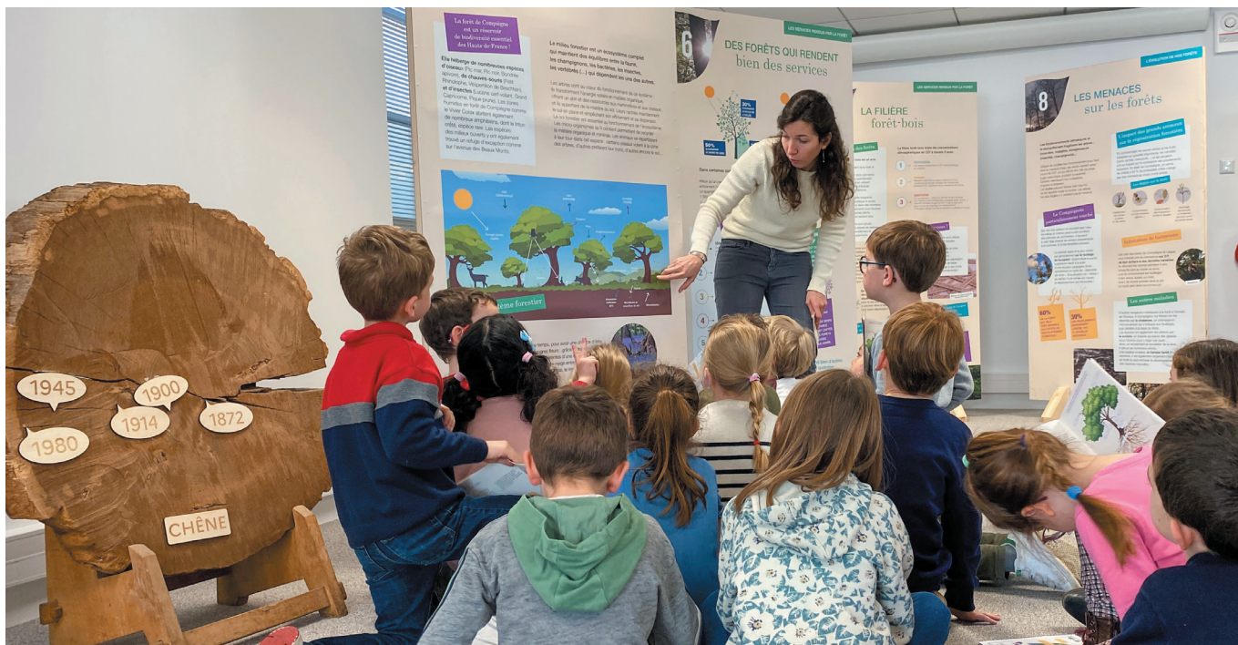
L'exposition « Les forêts du Compiégnois » présentée à la Maison des Projets a été organisée en partenariat avec l'APC et l'ONF.

des thèmes comme les économies d'eau, l'attractivité de l'industrie, le recrutement et les montées en compétences.