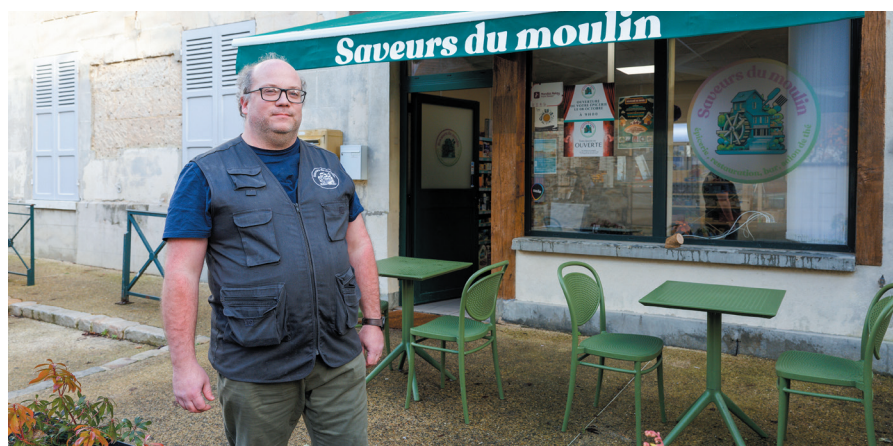
Pour réaménager le bar-épicerie de Vieux-Moulin, le gérant a pu déposer une demande de subvention. Ce projet répond aux logiques de soutien du commerce, de services de proximité et d'offre pour les touristes.

Son action repose sur des accompagnements individuels (visite en entreprise, conseil, aide à l'obtention de subventions...) et l'organisation d'événements collectifs sur