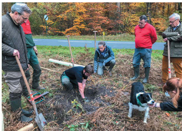
Élus, membres de l'association Oise nature et citoyens se sont retrouvés pour planter une trentaine d'arbres au carrefour du Bocage à Saint-Jean-aux-Bois.

Plus de renseignements : 03 44 37 31 16 europa.leader@grand-compiegnois.fr environnement@grand-compiegnois.fr territoire.industrie@grand-compiegnois.fr in « Grand Compiégnois »