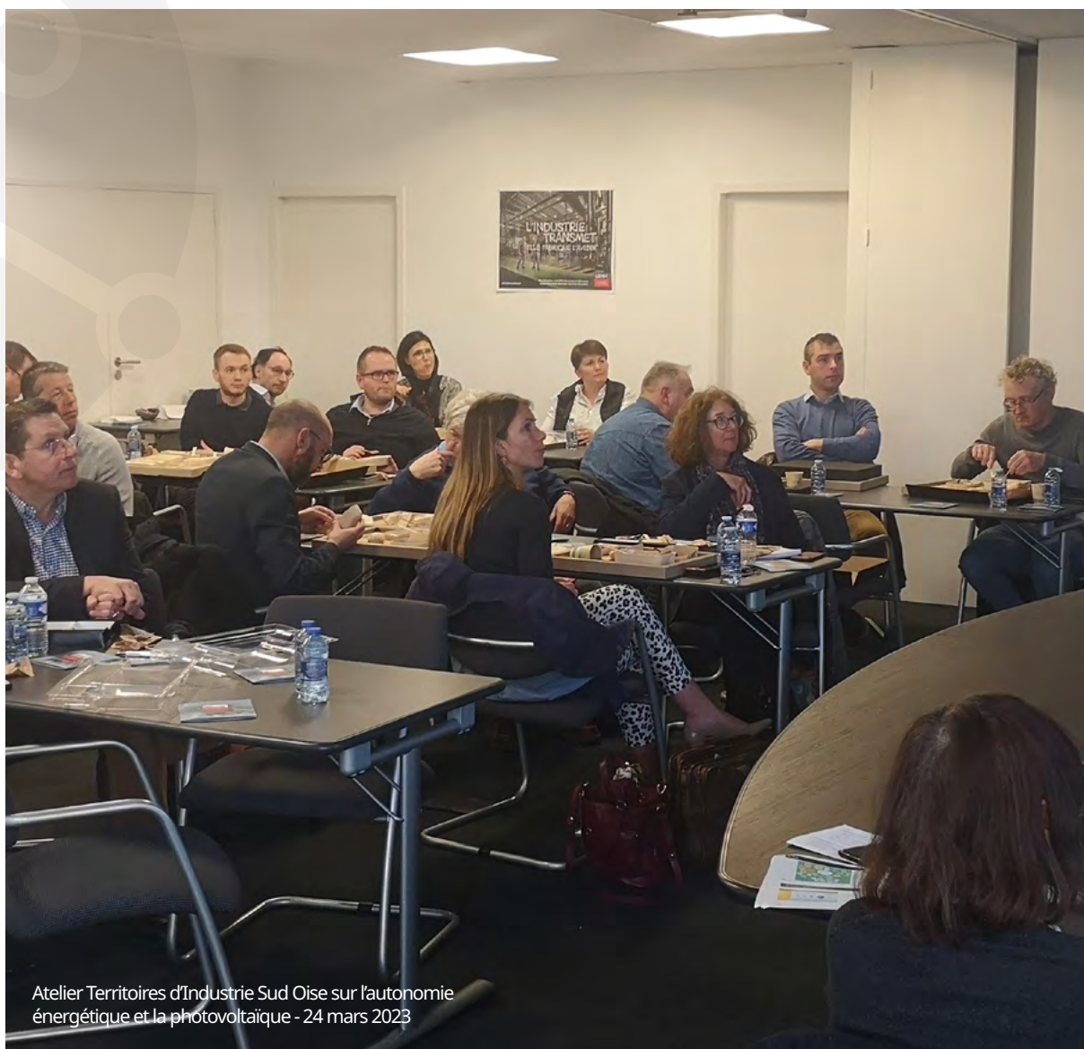
Atelier Territoires d'Industrie Sud Oise sur l'autonomie énergétique et la photovoltaïque - 24 mars 2023

Les trois territoires ont renouvelé leur label démontrant ainsi l'ancrage résolument industriel proactif.