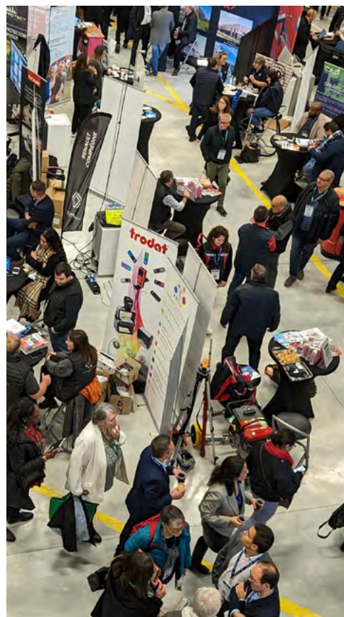
Entreprises et Territoires au Tigre de Margny-lès-Compiègne - 24 novembre 2023