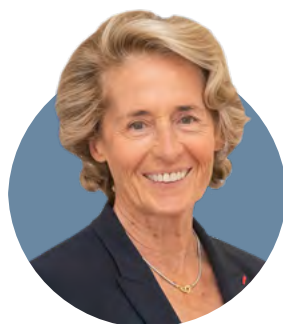
1 re vice-présidente : Caroline Cayeux

Président de l'Agglomération de la Région de Compiègne, Sénateur honoraire de l'Oise et Maire de Compiègne